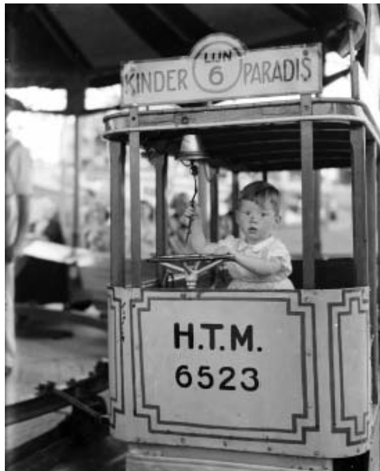
Draaimolen op de kermis op het Langgewenst, 1950.

In het begin van de twintigste eeuw nam de gemeente de verpachting op zich. Op de kermis van 1907 4 kostte de kleinste kraam negen gulden en de grootste f1.815. Dat waren respectievelijk de oliebolenkraam en het stoomcarroussel. Tot de Tweede Wereldoorlog bleef de gemeente de pacht voor de kermis innen, de organisatie voor volksfeesten was verantwoordelijk om via een collecte geld binnen te halen voor andere activiteiten rond Koninginnedag. In 1946 kreeg de Stichting Hilversums Comité Nationale Volksfeesten van de gemeente toestemming om de pacht voor de kermis te innen. De heer Signer, die de contacten met de kermisklanten onderhield, de toekenningen deed en ook de indeling van het terrein voor zijn rekening