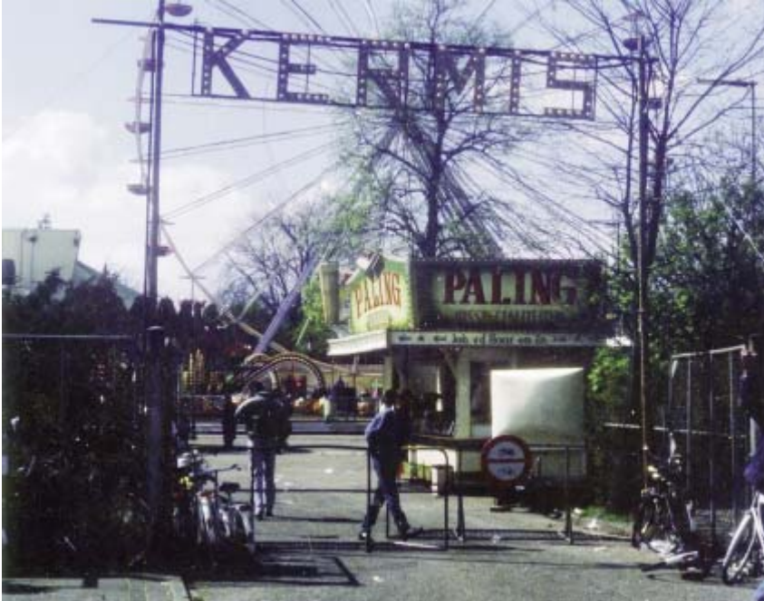
De toegangspoort van de kermis bij de Expohal.

het gejoel en geschreeuw der bezoekers vereenigden tot een dusdanig wanklankig geheel als door den volksmond met een heidensch of helsch lawaai pleegt te worden aangeduid en Dat een zoogenaamde Gooische feestweek bij uitnemendheid gewoonlijk niet door villabewoners pleegt te worden bezocht, maar voornamelijk strekt tot vermaak van den kleinen burgerstand. De gemeente beloofde rekening te houden met de bezwaren, maar de kermis bleef op dezelfde plek tot de Tweede Wereldoorlog dit vermaak verhinderde. In 1946 was er weer behoefte aan vertier. De kermis vond plaats op het Langgewenst. Vanaf 1968 werd het Matawitterrein tussen Langestraat en Ruitersweg tien jaar lang gebruikt, ondanks klagende winkeliers, verkeersopstoppingen, geluidsoverlast en ruimtegebrek.