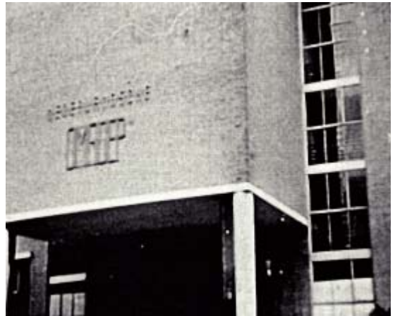
Na de samenvoeging van de omroepen tot de 'Nederlandsche Omroep' in 1941 verdwenen de Zaaier en de letters 'AVRO' van het gebouw, dat vanaf toen 'Studio A' heette.