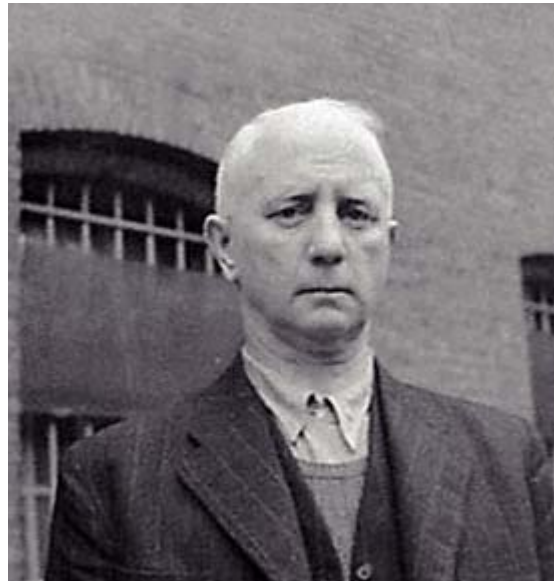
Max Blokzijl (1884-1946) was vanaf 1903 journalist. Vanaf februari 1941 verzorgde hij wekelijkse propagandapraatjes voor de Nederlandsche Omroep (links). Hij was vooraanstaand lid van de NSB en een van Nederlands bekendste collaborateurs. Als hoofd van de afdeling perswezen van het nationaalsocialistische Departement van Volksvoorlichting en Kunsten werkte hij aan de nazificering van de Nederlandse pers. Na de bevrijding werd hij gearresteerd (boven), ter dood veroordeeld en gefusilleerd.