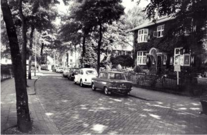
De Ministerlaan in 1969.

Mijn vader huurde het huis in 1933 met het eerste recht van koop, wat hij op 2 oktober 1942 effectueerde, waarschijnlijk met forse hulp van zijn schoonvader. Het huis was daarom zo interessant, omdat de grond tussen de Ministerlaan en het Noordse Bosje uit twee percelen bestond en het achterliggende deel bebouwd mocht worden met een bedrijfsbestemming. In de achtertuin, eigenlijk dus een apart kadastraal perceel met adres Noordse Bosje 31 AA, liet hij een tandtech-