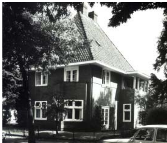
Minister Hartsenlaan 4a, vlak voor de sloop.