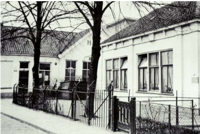
Het H.C.J.M.V.-gebouw en de bewaarschool, hoek Noordse Bosje, in 1957. (uit: Met hart en ziel )