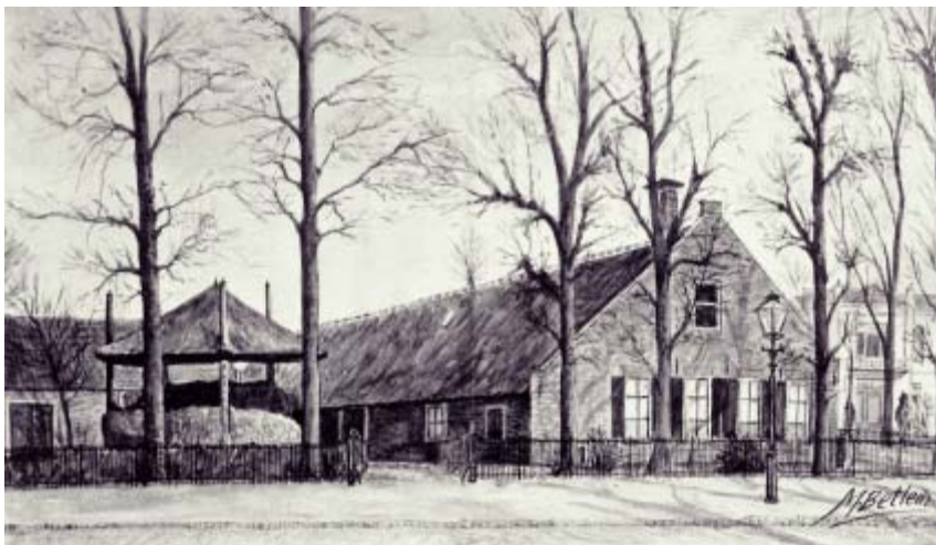
De boerderij van Brouwer. Rechts op deze tekening van Maarten Betlem vaag "Bouwzicht".

Langs de 's-Gravelandseweg werden vanaf 1843 enkele kapitale villa's gebouwd door rijke Amsterdamse kooplieden en regenten, meestal voor bewoning in de zomer. Rond 1850 waren dat onder andere Wisseloord, Lindenheuvel en Heuvelhoeve.