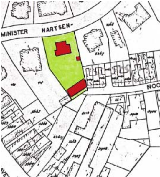
Kadastrale Kaart 1967. Gekleurd: Minister Hartsenlaan 4a.