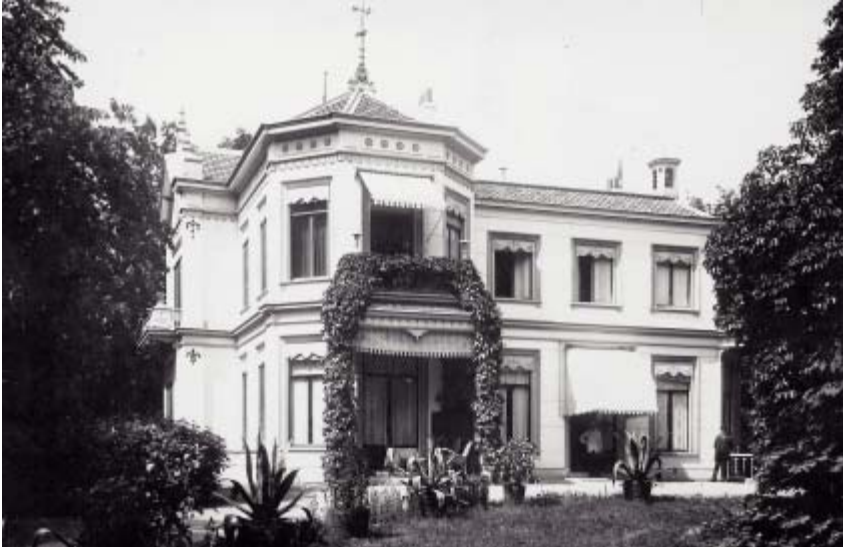
Villa Bouwzicht circa 1900.