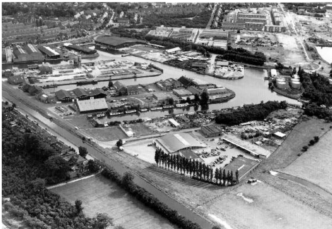
Luchtfoto van het Nieuwe Havengebied uit 1961 met op de voorgrond de veilinghal.