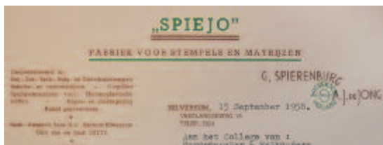
Briefhoofd op een bouwaanvraag uit 1958 van Spiejo, matrijzenfabriek aan de Vreelandseweg.

De gemeente had ook plannen om de laatste havenarm te dempen. Al jaren was de 3 e Havenarm de vaste plek van woonboten, die daarvoor zouden moeten verdwijnen. Hoewel de Raad van State begin 2001 stelde dat de bewoners geen garantie op een vaste plek konden krijgen, zag de gemeente later dat jaar af van verdere demping.