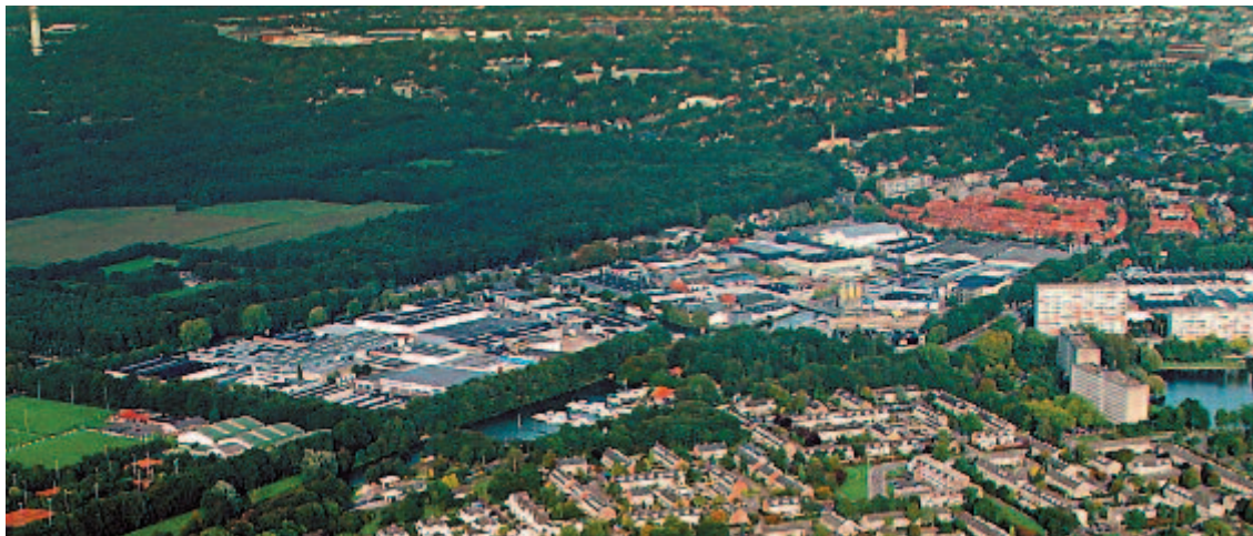
De Nieuwe Haven is tegenwoordig een nagenoeg volgebouwd industrieterrein.

lichting, schoorsteensystemen, voorzethaarden, inbouwhaarden, haardkachels, haardaccessoires, keukens, keukenapparatuur, keukentafels- en stoelen, keukenaccessoires, tegels en natuursteen en bijbehorende produkten alsmede de door u van halffabriek tot eindfabriek bewerkte sanitaire artikelen, kasten en kastsystemen en daarbij behorende onderhoudsmiddelen en materialen voor de verwerking van deze produkten.