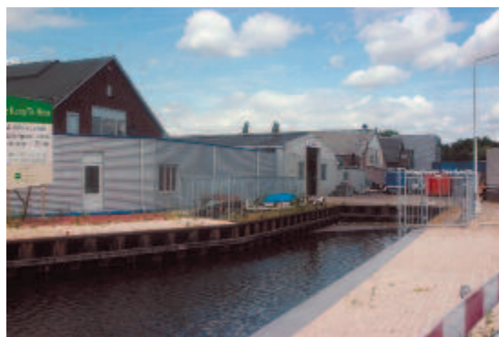
Een kort stompje is alles wat er na de demping overbleef van de Havenarm.