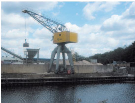
De hijskraan van de Mebin betonmortelcentrale aan de Zuiderloswal.

Ook Brakel werd op de vingers getikt toen bleek dat er buitenlandse werknemers in een clandestien gebouwde opstal waren ondergebracht. Bij de bouw van de veilingshal in 1941 waren bouwvakkers gehuisvest in een