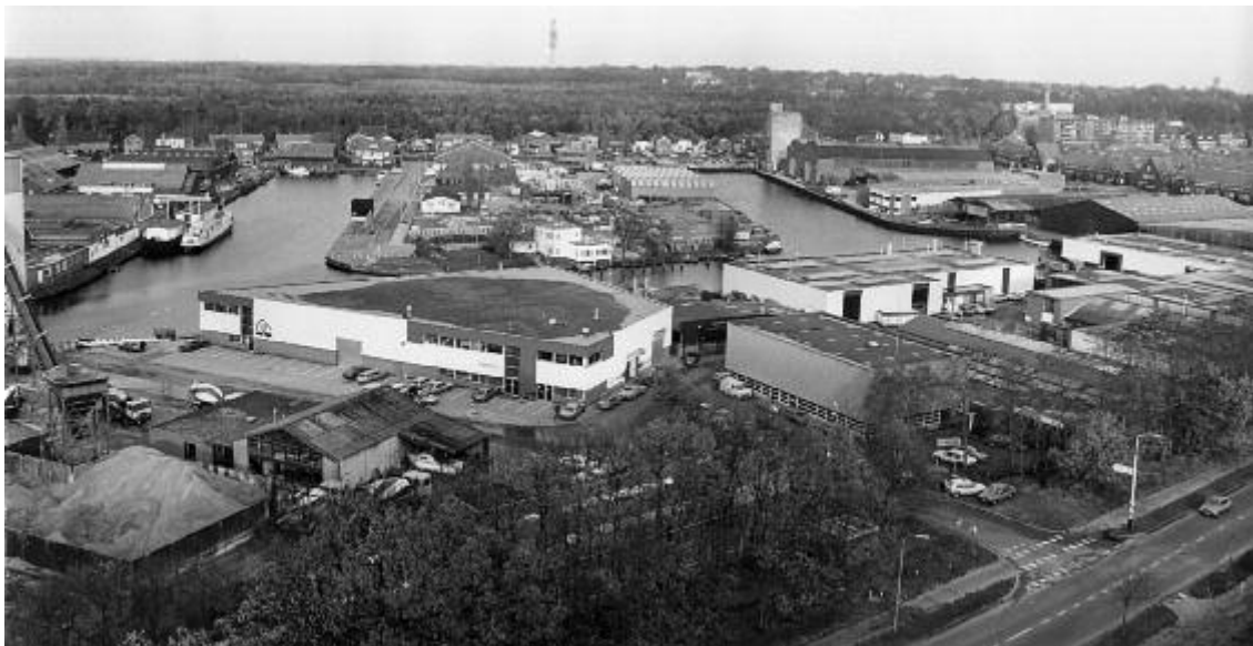
De 1 e en 2 e Havenarm in het begin van de jaren '80.