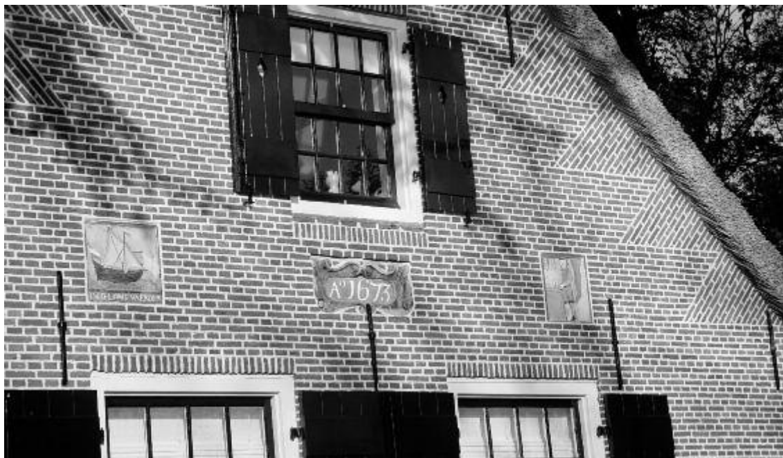
De gevelstenen op het bekende pand aan de Beresteinseweg.

langhuis. Wel is duidelijk, en dit boekje is hiervan het bewijs, dat het een boerderij met historie is.