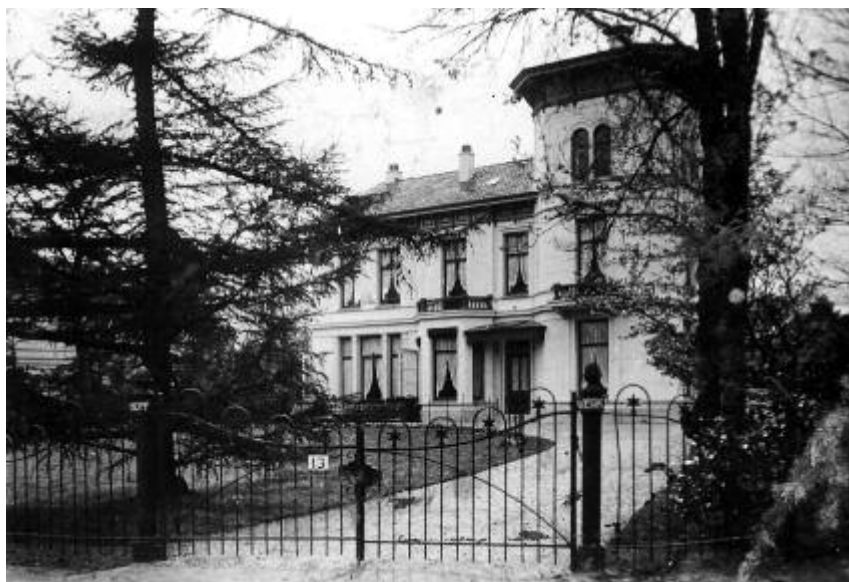
De eerste decennia had de villa nog geen naam.