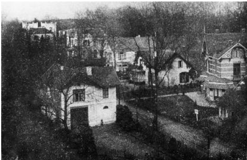
Foto van het koetshuis/garage genomen vanuit de toren van Hoffwerk.