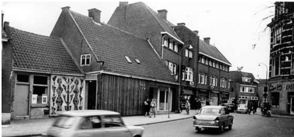
Het verbouwde GSA-pand in de jaren '60 met links het mozaïek van Jan Oosterman.