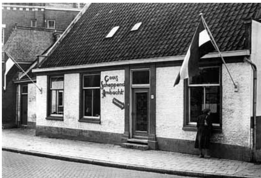
Het pand van het Goois Scheppend Ambacht GSA bij de opening in 1949.

Waarschijnlijk ontwierp en vervaardigde Oosterman dit kunstwerk in 1958 ter gelegenheid van het 10-jarig bestaan van het Goois Scheppend Ambacht. Het oude GSA-gebouw, de voormalige winkel van de boekhandelaar Heek aan de Kerkbrink, was in 1949 verbouwd tot tentoonstellingsruimte. Door het kleurrijke mozaïek naast de voordeur kreeg het pand de uitstraling van een kunstinstelling.