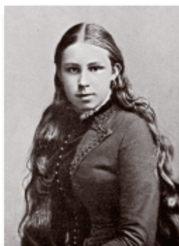
Henriette Roland Holst als tiener.

Henriette Roland Holst (1869-1952), dichteres en socialiste. In de zomer van 1895 verhuisde Henriette van der Schalk met haar moeder van haar geboorteplaats Noordwijk naar Hilversum. Daar betrokken zij een inmiddels afgebroken villa op de Lindenheuvel (11). Het jaar daarop trouwde ze met Richard (Rik) Roland Holst in het Oude Raadhuis op de Kerkbrink. Daarmee werd ze tante van Adriaan Roland Holst. Het echtpaar ging wonen in een huis op het landgoed Schoonoord, Zuidereind 11 's-Graveland.