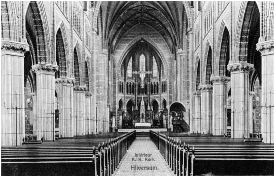
Het interieur van de St. Vitus. Dit is een vrij vroege foto. Je ziet de situatie van vóór het Tweede Vaticaanse Concilie. Daarna is het interieur ingrijpend gewijzigd, onder meer wat het altaar en de preekstoel betreft. De priester stond voortaan niet meer met zijn rug naar de gelovigen toe. Onder: vrouwenzaal 2 van de Rooms Katholieke Ziekenverpleging, RKZ. Dit beeld is verdwenen: met zijn allen open en bloot op een zaal. Ziekenhuizen is ook een thema wat je kan verzamelen.