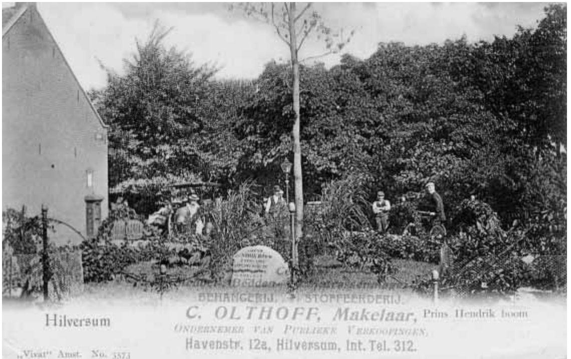
Onder: Achterom, hoek Emmastraat. Waar nu een vreemde verhoging in het trottoir is, stond vroeger de in 1901 geplante Prins Hendrik Boom. Dit was kennelijk geen geliefde Ansicht; een makelaar heeft hem met behulp van een stempel als reclamekaart gebruikt.