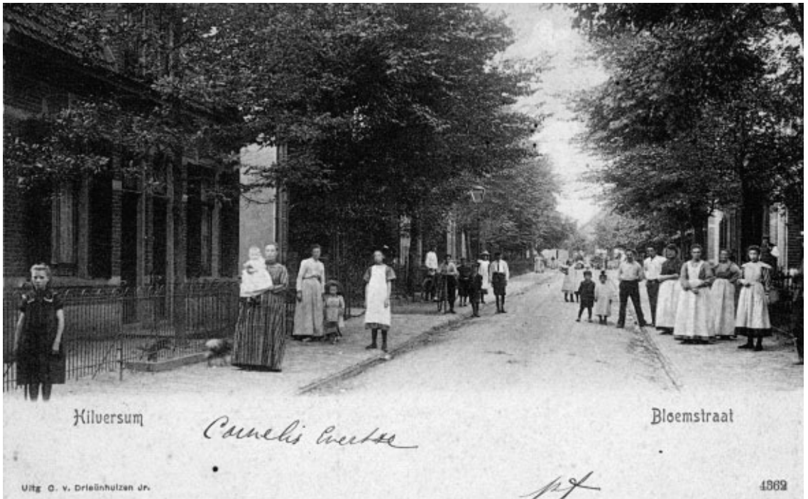
De Bloemstraat. Je ziet echt dat er fotograaf in de straat was. Kijk eens naar al die mensen, die schorten, die moeder met dat kind.