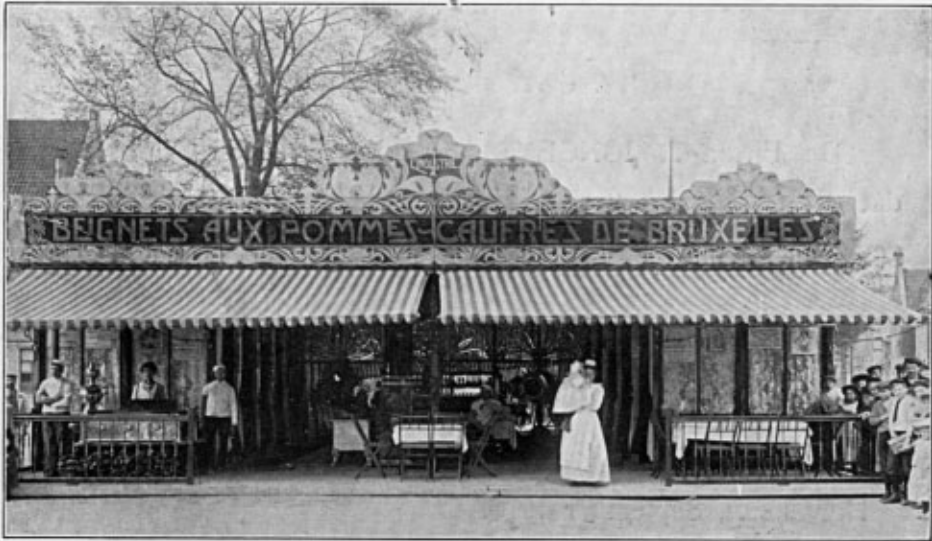
L'extérieur de l'établissement l'Industrie — Firma J. JONGEMAETS.

Bespeelt op Uwe Spreekmachine steeds Odéon-Records.