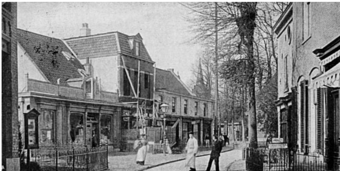
„Vivat“ Amst. No. 5166. Kerkstraat.