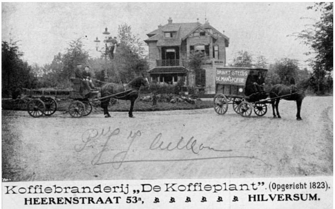
Bijna een reclamekaart. De afzender staat midden op de kaart. Dit is bij het perkje in de Oude Engweg, herkenbaar aan die lantaarnpaal. En kijk eens naar de reclame op die kar. Een heel leuke kaart.