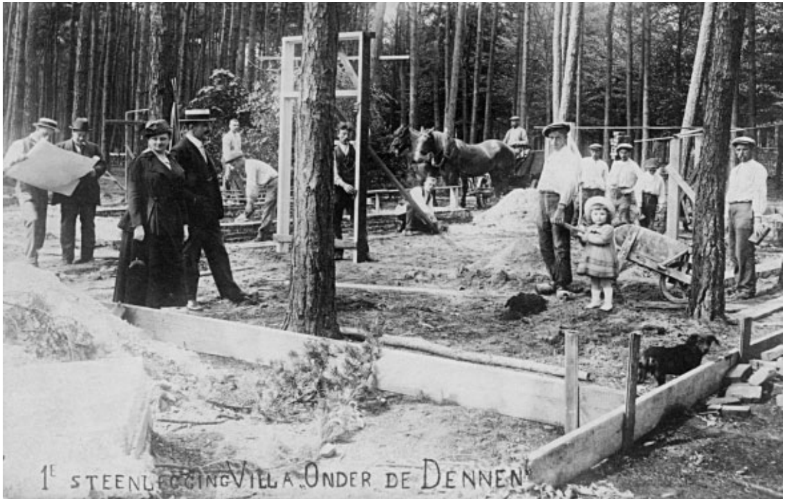
Waar deze villa precies heeft gestaan weet ik niet. Ik moet daarvoor nog een keer naar het archief. Ik heb ook een kaart waarop de villa klaar is. Die is van 1908. Dit soort kaarten zie je bijna niet. Ze waren alleen interessant voor familieleden en dergelijke.