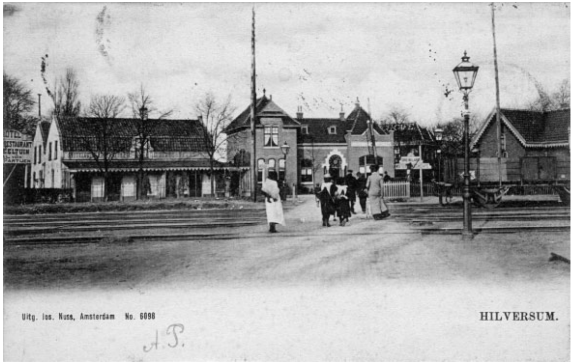
De spoorwegovergang aan de Laarderweg, nog zonder spoorbomen. De mensen steken op hun gemak over. Deze kaart is in 1904 verstuurd.