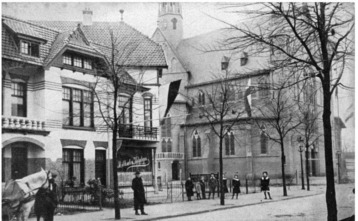
De Naarderstraat met de Onze Lieve Vrouwekerk en melksalon Welgelegen. De vlaggen hangen uit. De meeste ansichten zijn van de andere kant genomen. Blijkbaar ging het de fotograaf niet om de kerk maar om het straatbeeld.