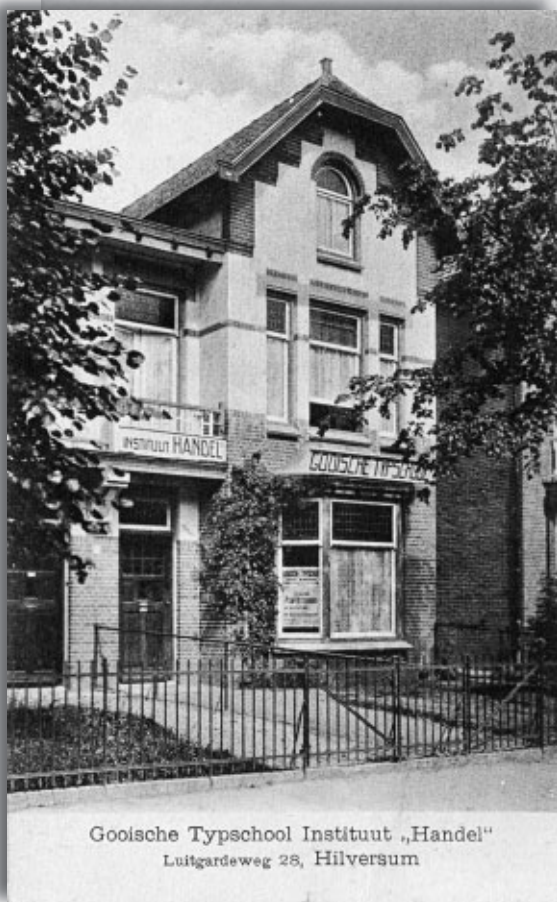
Gooische Typschool Instituut „Handel“ Luitgardeweg 28, Hilversum

Een Vivat-kaart van de Kerkstraat uit 1905. Leuk dat ze aan het verbouwen zijn. Een mooi plaatje van de Kerkstraat.