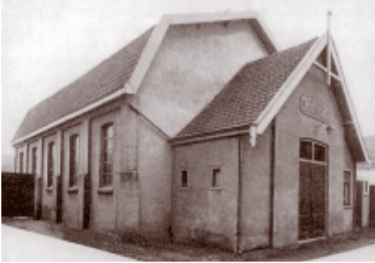
Gebouw van de Hersteld Apostolische Zendinggemeente aan de Violenstraat.