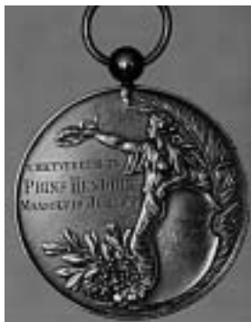
De door J.A. Dekker in 1905 in Maassluis gewonnen medaille. (part. coll.)

Utrechtsche Straatweg 13b, die niet alleen graag wilde dat de straatverlichting werd doorgetrokken, maar ook dat de schietbaan werd verplaatst. Omdat de kogelvangers op 25 en 50 meter van zijn huis stonden, waren er op 2 augustus drie kogels over zijn terrein komen vliegen. De burge-