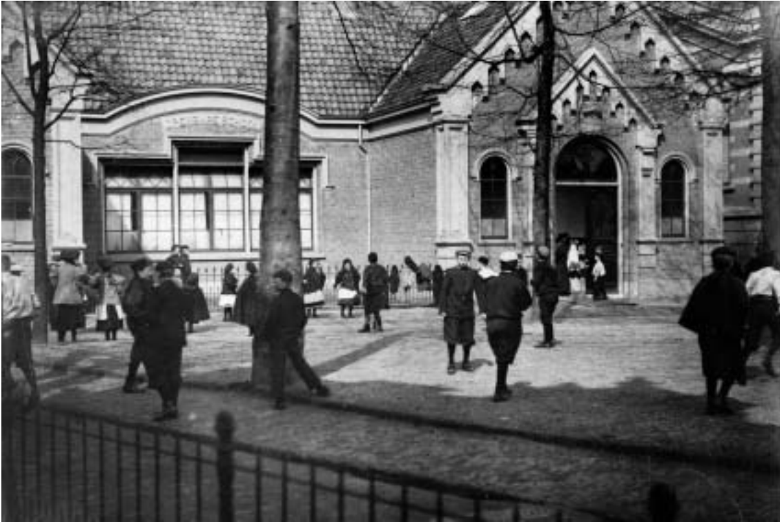
De lagere school op de Kerkbrink rond 1892.

deutje kreeg van het schoolbestuur. Dat was net ingesteld en het lijkt aannemelijk dat zij ook de eerste was, die een dergelijke gift mocht ontvangen.