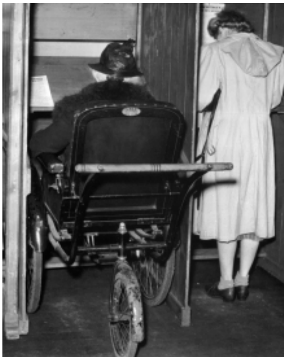
Tweede Kamerverkiezingen in 1948.

Op 24 maart 1964 was er hoog bezoek voor het bejaardencentrum. Mevrouw Lübke, de echtgenote van de West-Duitse bondspresident, was er die dag ruim