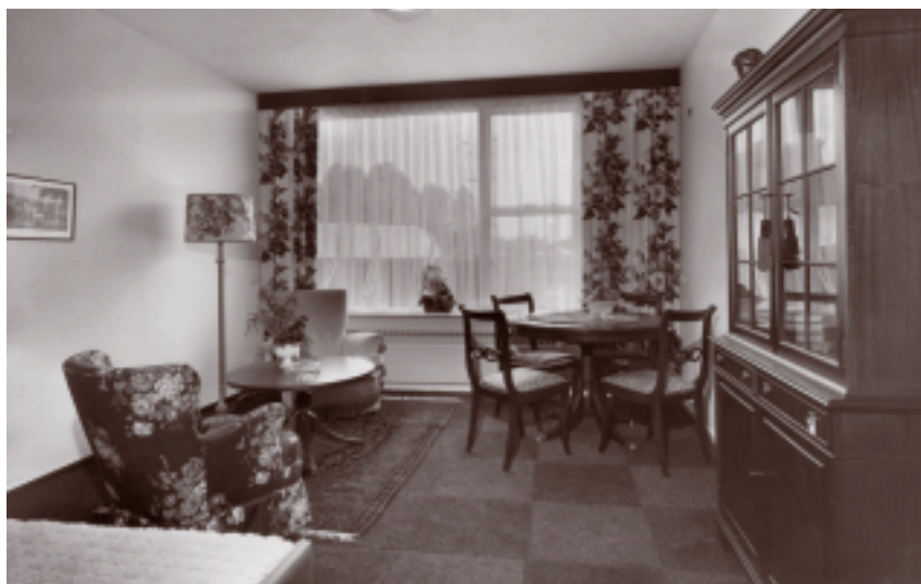
Het interieur van een model- kamer van Flat Kerkelanden in oktober 1969.

Flat Kerkelanden bestaat uit twee bouwblokken. Het eerste bestaat uit zes bouw-lagen. Dit verzorgingshuis biedt onderdak aan 162 alleenstaande bejaarden en achttien echtparen. De wooneenheden hebben een toilet, douche, kookgele- genheid, en een koelkastje. Voor alleenstaanden gaat het om een zitslaapkamer, de echtparen hebben een aparte slaapkamer en woonkamer. Iedere etage heeft