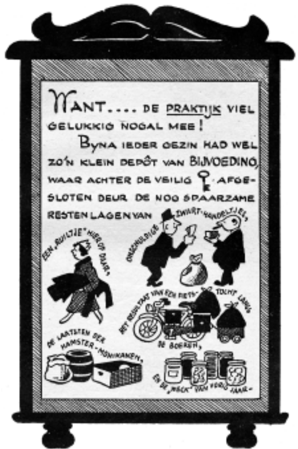
In de praktijk viel het met de honger nog wel mee, althans voor hen die nog wat te ruilen hadden, nog wat voorraad hadden of 'de boer op' konden. Uit: O, dat winterje '45. (coll. auteur)

Door de spoorwegstaking en het daarop volgende verbod van Seyss-Inquart op scheepsvervoer, kwam de aanvoer van voedsel naar het westen van ons land op een erg laag pitje te staan. Wel werd het verbod op scheepsvervoer eind november opgeheven en gingen de schippers zelfs samenwerken in een nationale rederij, maar toch bleven de tekorten oplopen. Niet dat de hoeveelheid beschikbaar voedsel nu zo erg klein was, maar de gemeenten hadden al eerder in 1944 niet meer de mogelijkheid gehad om enige voorraad voedsel op te bouwen. Het probleem zat hem daarnaast in de ongelijke verdeling van het beschikbare voedsel. In de plattelandsgedebieden van bezet Nederland was er nog ruim voldoende eten, maar in de steden niet. En transport was moeilijk geworden: geen trein, geen schepen, vrachtauto's die vanuit de lucht beschoten werd. Vandaar die nationale rederij, om zo via het IJsselmeer toch nog voedsel in de grote steden te krijgen. Totdat eind december het IJsselmeer dichtvroor. Hilversum heeft getracht op allerlei manieren toch