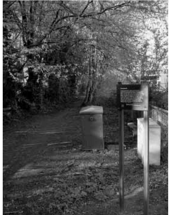
Het Dievenpaadje naar Naarden.

Het ontwerp van dit bordje riep nog meer vragen op: Hoe zat het dan met de organisatie van de rechterlijke macht? Hilversum kreeg toch al in 1424 een schout die kon rechtspreken (daarmee werd Hilversum een zelfstandig dorp)? En in de 17e en 18de eeuw hadden de schout en de schepenen in het Regthuis (nu Oude Raadhuis) toch ook de bevoegdheid tot rechtspraak? Maar halsmisdaden werden berecht door de schout van Naarden uit naam van de baljuw van Gooiland. Als dat zo is, dan is de naam 'Dievenpaadje' een eufemisme. Zeer ernstige misdrijven werden sinds 1811 (Franse