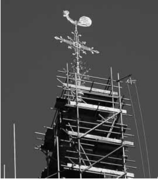
De gerestaureerde torenhaan en -kruis.

Nadat het kruis was verankerd kon de haan er bovenop worden geplaatst. De haan kan vrij draaien op een stalen kogel om een roestvrij stalen spil.