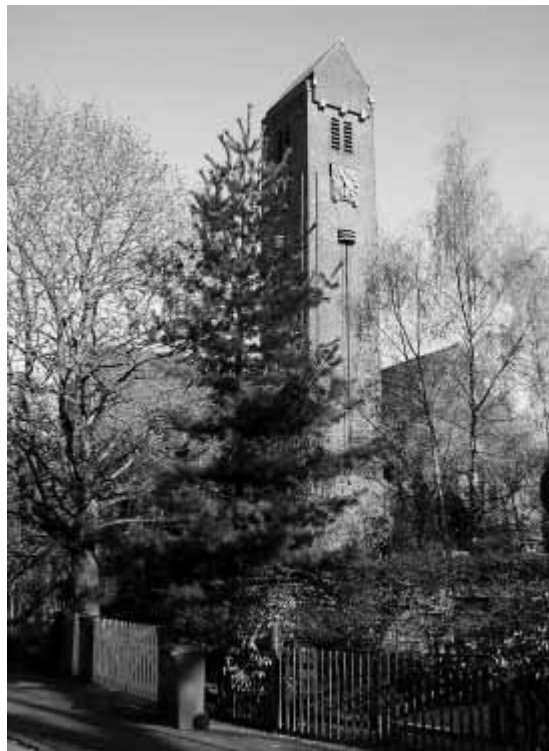
De Tesselshadekerkerk.

slotte heeft de Hilversumse monumentencommissie in het verleden positief geadviseerd over plaatsing op de rijkslijst. Colleges en gemeenteraad hebben toen op economische gronden anders beslist. Mocht de gemeente het verzoek 'onverhoopt' tóch afwijzen, dan moet dat wel met redenen omkleed worden, stelt Dubbelaar. Waarna het genootschap weer de gelegenheid heeft om naar de gemeentelijke commissie voor bezwaar- en beroepschriften te stappen. En vervolgens – bij nul op 't rekest – de gang naar de rechter te maken. Dat de plannen voor het terrein nu al jaren stilliggen, is volgens Dubbelaar niet de schuld van zijn genootschap, maar van de gemeente. De gemeente heeft in het verleden gewoon haar werk niet gedaan, stelt hij. Wij beschouwen de Zuiderkerk als een ankerpunt in Hilversum-Zuid en zullen er alles aan doen om hem te behouden. Het laatste nieuws is, dat de gemeente waarschijnlijk kiest voor behoud van de toren in combinatie met de bouw van een aantal appartementen, een ondergrondse supermarkt en een parkeergarage.