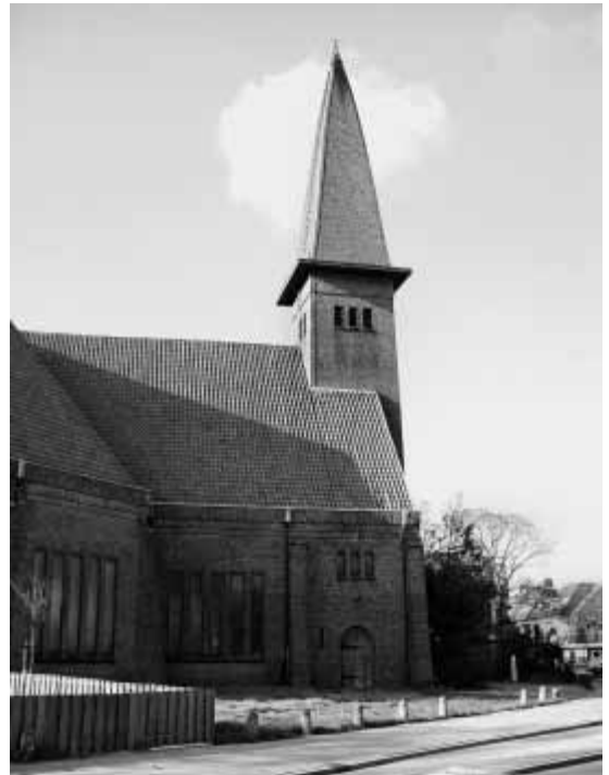
De Zuiderkerk.

De gemeente kocht acht jaar geleden de voormalige gereformeerde kerk, die in 1924 is gebouwd naar een ontwerp van architect A. de Maaker. Een sloopvergunning werd verleend. Voor de invulling van het terrein op de hoek van de Gijsbrecht van Amstelstraat en de Nieuweg werd uiteindelijk gemikt op de bouw van een supermarkt, met woningen erbovenop, en een parkeergarage eronder.