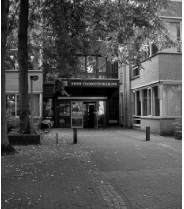
Het Streekarchief in Hilversum, gevestigd in het souterrain van de Dienst Stadsontwikkeling, heeft altijd een open deur voor bezoekers.

internet: www.hilversum.nl/streekarchief