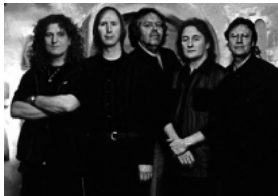
In de 'Down Under Studio' aan de Dalweg, vlakbij de oude repetitieruimte in de Nissenhut (1999).

De tijden zijn veranderd, en Kayak ook. Vroeger stond je alleen maar muziek te maken. De rest maakte niet uit: hoe eruit zag, wat je deed, wat het publiek ervan vond. Het was hip om geen contact te maken met het publiek. Dat is nu heel anders. Onze optredens zijn energiekier dan ooit. En de muziek is de bindende factor. Kayak doen we erbij, de band kan zichzelf bedruipen. Vanaf eind januari hebben we in 25 theaters opgetreden en daarna is ieder weer zijn eigen gang gegaan.