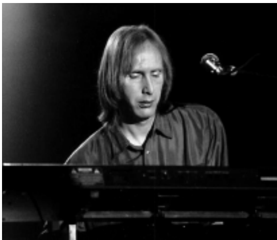
Ton achter de toetsen tijdens een recent optreden.

Tijdens de komende tournee zal Kayak ook zijn geboorteplaats aandoen: voor 26 april 2003 staat een optreden in theater Gooiland gepland.