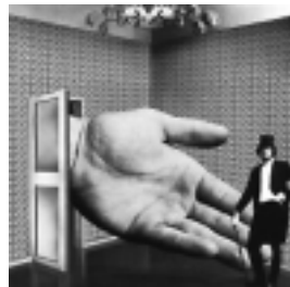
De hoer van 'Kayak' (1974), het tweede album.

met hun griezelige act. Maar de muziek van deze Nederlandse bands uit de jaren zestig heeft die van High Tide Formation niet beïnvloed.