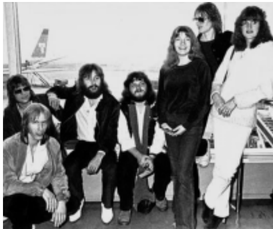
Op het vliegveld, vlak vóór het vertrek naar Amerika. Het album 'Periscope Life' werd in 1980 in Los Angeles opgenomen.