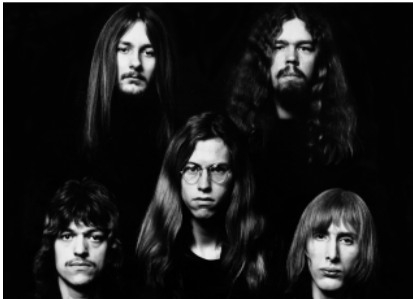
Groepsportret dd. mei 1975.