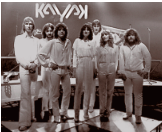
Kayak bij een opname voor het televisieprogramma Toppop in de Hilversumse studio's (maart 1981).

In de daaropvolgende jaren volgen nog drie albums, waarna Kayak in 1982 uiteenvalt. De vele wisselingen hadden vooral te maken met muzikale en carrièrematige verschillen, blik de Hilversummer terug. Maar begin jaren tachtig speelden er ook persoonlijke zaken mee. In die tijd was het al