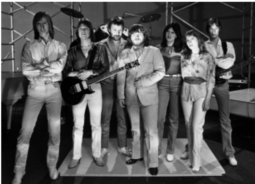
Een televisie-optreden in 1982.