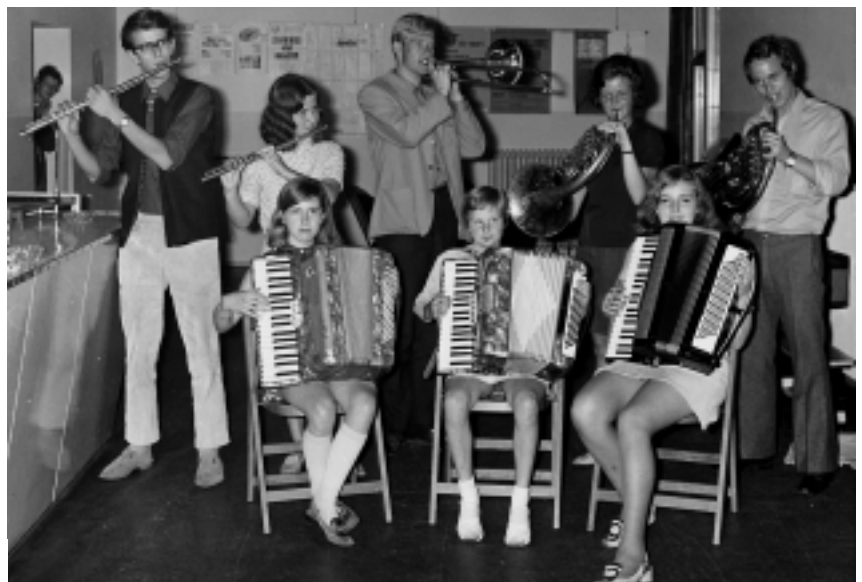
Leerlingen van de Hilversumse Muziekschool in 1969.

Ton zit inmiddels op de middelbare school, op de havo-afdeling van de Gemeentelijke Scholengemeenschap aan de Jonkerweg/Schuttersweg (later omgedoopt tot A. Roland Holst College). Met het leren gaat het niet al te goed, met de muziek des te beter. Vanaf