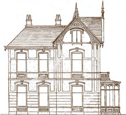
Aanzicht Noordelijke gevel