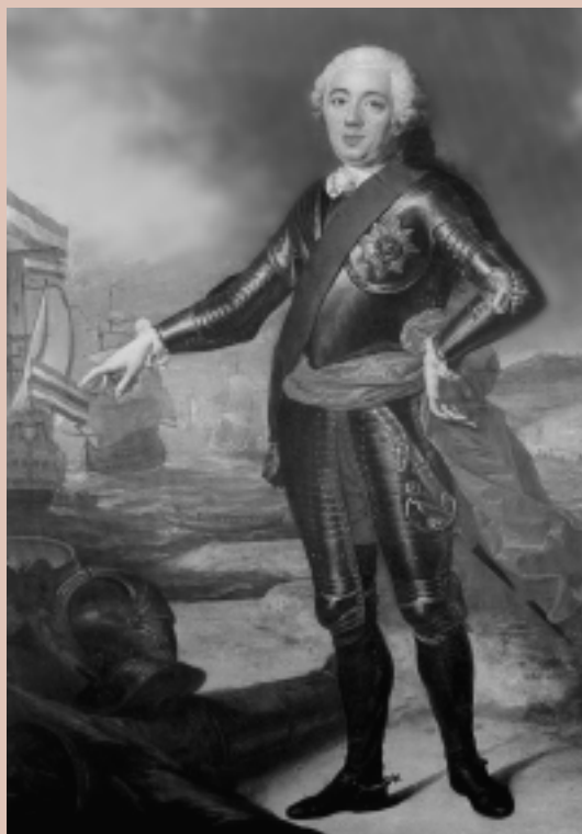
Stadhouder Willem IV (1711-1751), geportretteerd in 1751.

Na het overlijden van Anna van Hannover werd de hertog van Brunswijk voogd over de jonge Willem V. Hij nam tot de meerderjarigheid van de prins de honneurs