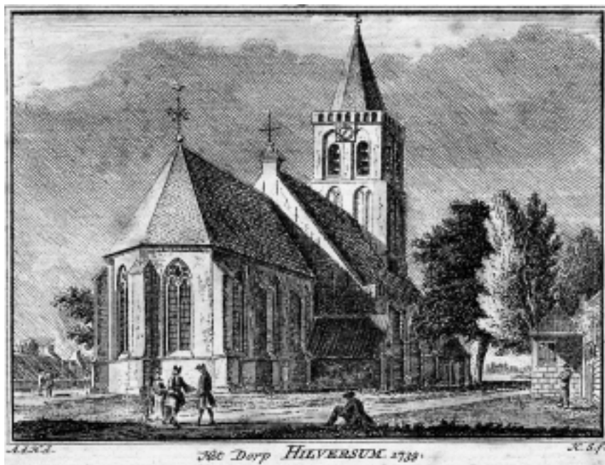
Ingekleurde gravure van de Kerk aan de Kerkbrink in 1739, gemaakt door H. Spilman naar een origineel van H. de Haen.

bevestigen dit beeld. Zowel bij de verkiezing van kerkenraadsleden als de benoeming van dorpsbestuurders circuleerden vaak dezelfde namen. De één kwam wat meer voor in de kerkenraad; de ander bezette wat vaker een zetel in het dorpsbestuur. Sommigen komen we in beide colleges tegen.