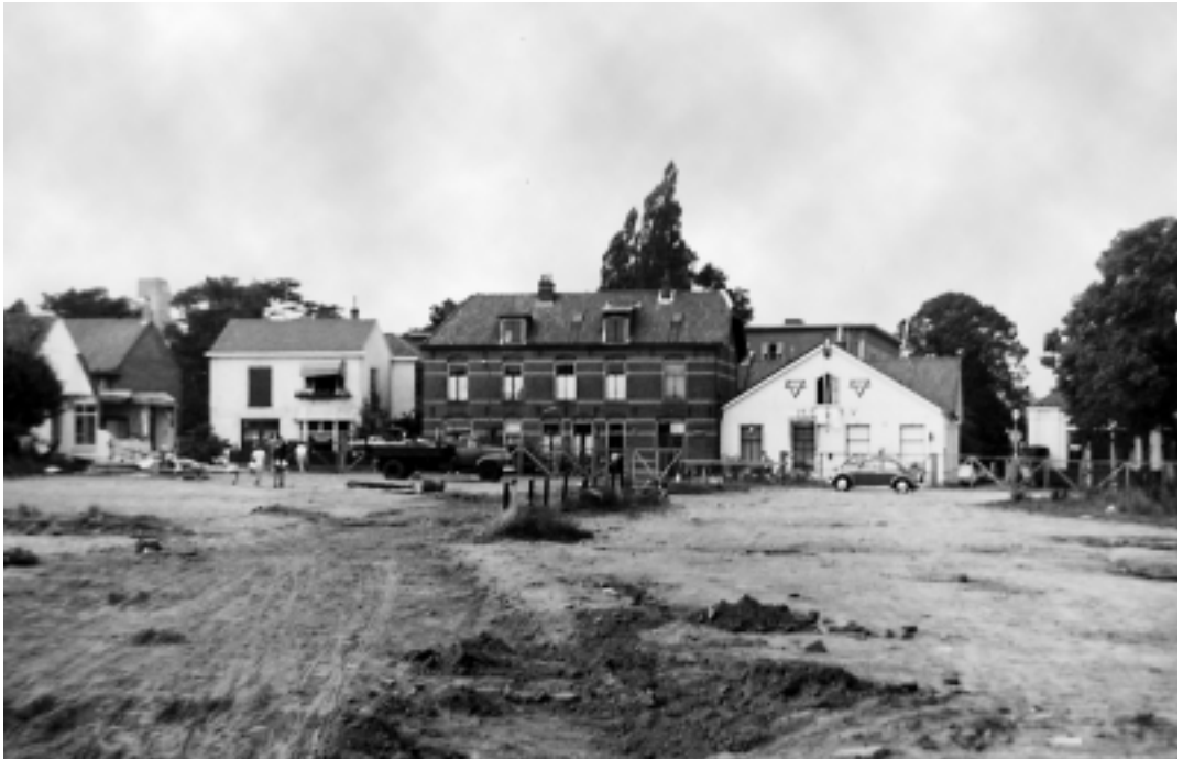
Sloopwerkzaamheden aan het Noordse Bosje in 1970. Op deze plek verrees een parkeergarage. Rechts is het verenigingsgebouw te zien.