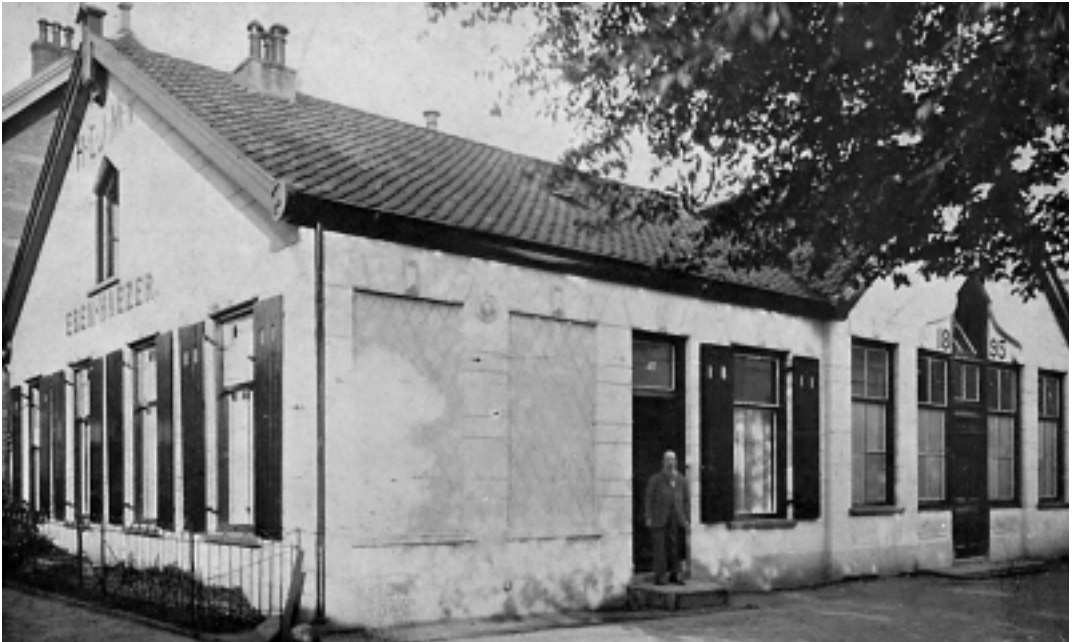
Boven: Eben Haëzer aan het Noordse Bosje (nr. 45) bood onderdak aan de Hilversumse Christelijke Jongemannen Vereniging (H.C.J.M.V.). In 1935 vierde de vereniging, die zich inmiddels had aangesloten bij het Nederl. Jongel. Verbond (N.J.V.), zijn 40-jarig jubileum. De vereniging, die ten doel had 'jonge mensen tot Christus te brengen', had in die tijd zo'n driehonderd leden. Met onderafdelingen als schaakvereniging De Pion, A.S.V. Altius (voetbal, korfbal en atletiek) en de Christelijke Mondaccordeonclub Excelsior.