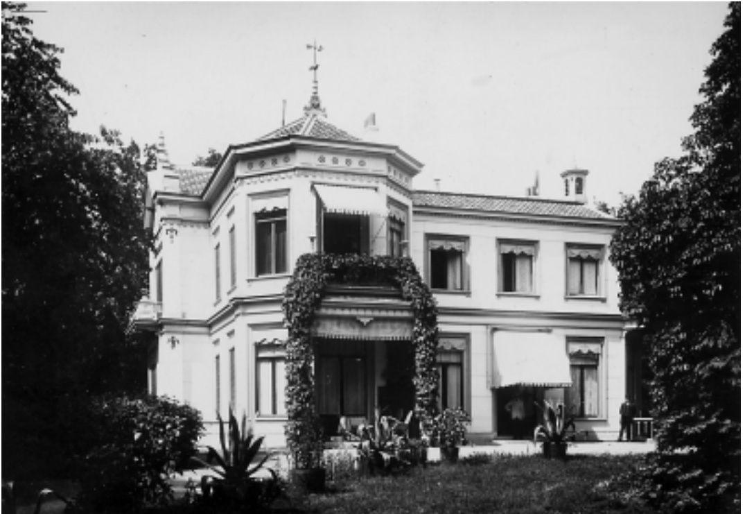
Villa 'Bouwzicht' op de hoek van de 's-Gravelandseweg en de Oude Enghweg omstreeks 1910. In 1872 gebouwd in opdracht van de latere minister Cornelis Hartsen, en in 1912 afgebroken.