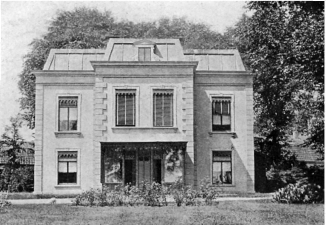
De achterzijde van villa 'Ouden Engh' aan de Hoge Naarderweg (nr. 12) anno 1901, het eerste Uniehuis van Hilversum. Dit tehuis voor dronkzuchtige vrouwen werd in 1912 afgebroken.