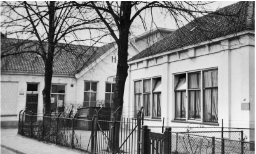
Onder: het H.C.J.M.V-gebouw aan het Noordse Bosje met op de voorgrond de bewaarschool, gefotografeerd in maart 1957.