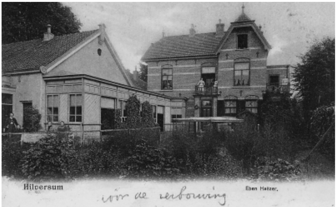
Het rusthuis aan de achterzijde, vóór de verbouwing.