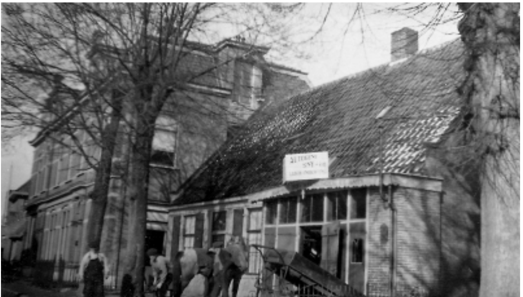
In het pand aan de 's-Gravelandseweg werd later een smederij gevestigd en nog later een garage. Toen deze foto werd gemaakt was de firma Renou al vertrokken naar de Herenstraat.