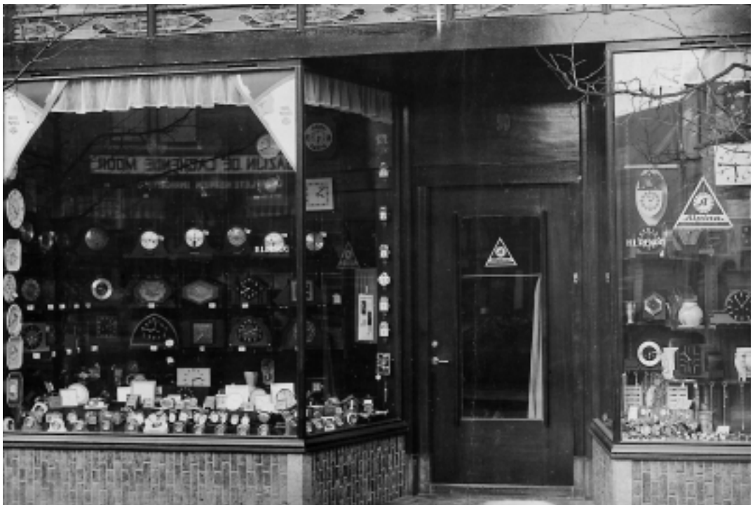
Het nieuwe pand aan de Kerkstraat na de feestelijke opening op 29 juli 1922.