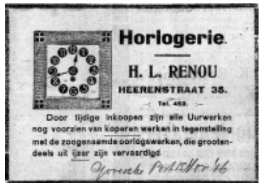
Tijdens de Eerste Wereldoorlog kwam al spoedig schaarste aan materialen en onderdelen.

uit Duitsland en Zwitserland. In Nederland werden alleen Friese staartklokken en zogeheten Zaanse klokken gefabriceerd waar bijna geen vraag meer naar was. Niet alleen Renou maar alle 'horlogers'