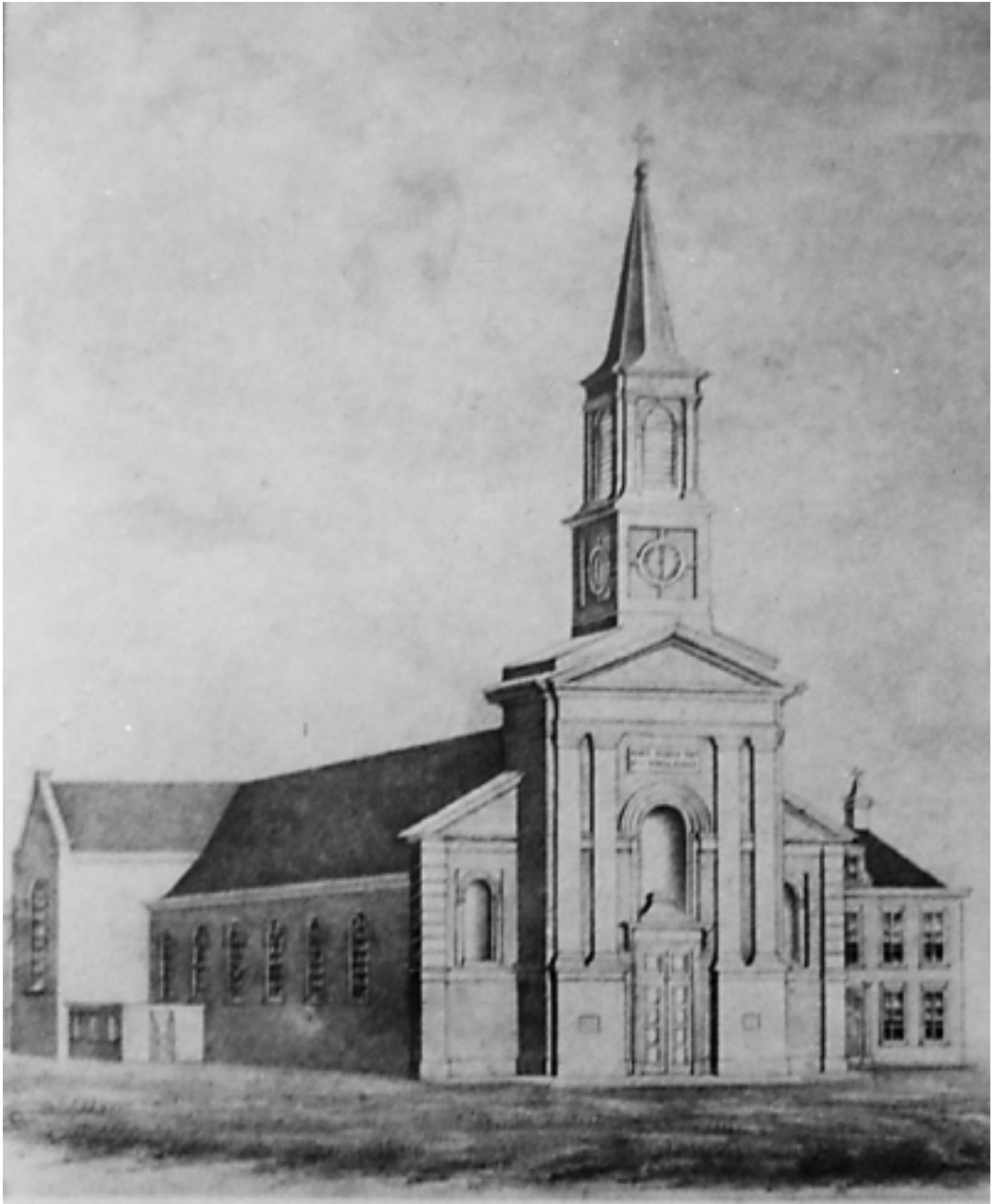
Tekening van de oude Vituskerk aan het Veeneind (Emmastraat), toegeschreven aan Brouwer.