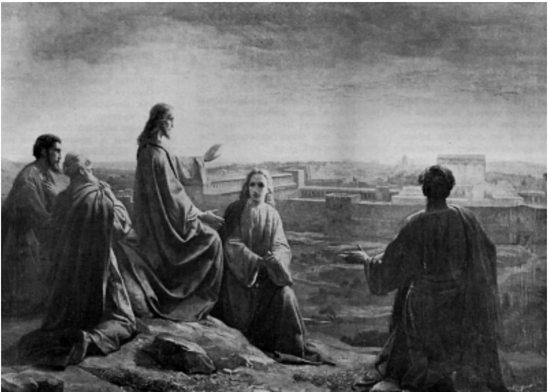
Jezus op de Olijfberg voorspelt de verwoesting van Jeruzalem.

Pièce de résistance vormen natuurlijk de veertien grote kruiswegstaties van de Vitus. Zij laten de lijdensweg, de kruisdood en de graflegging van Jezus zien. Als de spotjes aangaan, komen de in 1981 gerestaureerde schilderijen tot leven. Dan is ook te zien dat de twaalfde statie een extraatje