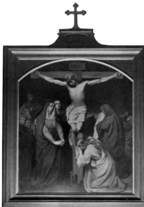
Een van de kruiswegstaties in de Vituskerk. (uit: Wij in Hilversum )

Hij schilderde onder meer de Vincentius en Maria , die nu nog in de Vitus te bewonderen zijn. Ook leverde de Hilversummer een bijdrage aan de bekende Historische Galerij in het Amsterdamse Arti