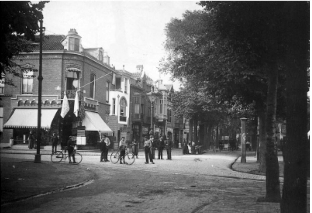
Het kruispunt Groest-Kerkstraat rond de eeuwwisseling. Deze plek werd algemeen "de Allemansbrug" genoemd omdat er na werktijd altijd wel groepjes mannen of jongens rondhingen. Het is dus niet verwonderlijk dat dit ontmoetingspunt een belangrijke rol speelde in het kermisoproer.

werd schieten gezien en gehoord in de Spoorstraat, zoodat ik, niet wetende in welke richting en door wie geschoten werd, langs de linkerzijde der huizen gedekt, vooruitgerukt. Op het genoemde snijpunt was juist gevochten door een 7.tal agenten van politie tegen eene groote menigte, de ijzeren platen der goten waren opengebrosen. Ik heb daarop front gemaakt naar het brandspuithuis op het noordpunt van de Groest. Blijkbaar waren de zijstraten en enkele sloppen van de Groest door de kwaadwilligen bezet.