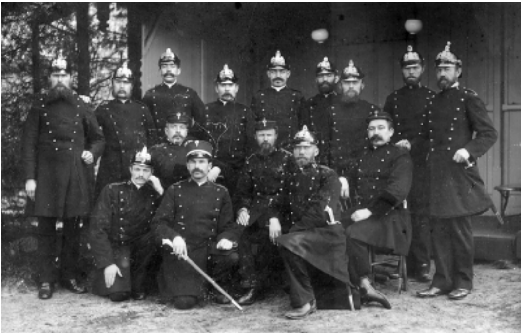
De politie kon de opstandige bevolking niet aan en moest worden bijgestaan door eerst de schutterij en later zelfs door het leger.

Tijdens de vergadering van 27 december daaropvolgend bleek ook de raad verdeeld te zijn. Het al genoemde raadslid Peet was tegen: Om over te gaan tot zoo ingrijpenden maatregel als het opheffen van dit jaarlijksch volksfeest, waarop het volk recht meent te hebben – en welk recht het zich naar hij vreest, niet zonder verzet zal laten ontnemen – moeten z.i. twee voorwaarden worden vervuld: 1e moet daartoe een sterke aandrang komen; 2e moet het algemeen belang den maatregel vorderen. Ofschoon persoonlijk geen voorstander van de kermis, vat hij zijne taak als raadslid zoo op, dat hij moet bevorderen het bewaren van den vrede en het eerbiedigen van een ieders recht, zoodat hij niet mag medewerken tot afschaffing der kermis tegen de wil des volks. Raadslid Banga was echter voorstander van een verbod: De ingenomenheid met de kermis is slechts een volkswaan, waaraan een einde moet worden gemaakt. Het geldelijk voordeel voor de gemeentekas en voor particulieren (in-