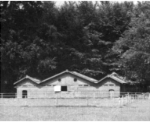
De gnoestallen in de gnoeweide, begin jaren '70. Deze stallen zijn een van de laatste herinneringen van Blaauws activiteiten op Gooilust. Coll. Goois Museum.

Natuurmonumenten, die de buitenplaats een unicum in Europa noemt: "s-Graveland vestigt hier de fabriek alleen uit zucht om enige industrie te krijgen". Maar daaraan kleven volgens hem grote bezwaren voor een zo landelijke gemeente als 's-Graveland. [...] 'kan die gemeente bijvoorbeeld vraagstukken als werklozenzorg, brandveiligheid, enz. het hoofd bieden?' [...] Verschillende bezwaren tegen de kininefabriek komen aan de orde: stankoverlast, bodem- en waterverontreiniging, aantasting van natuurschoon, en natuurlijk de ligging naast het landgoed Gooilust.