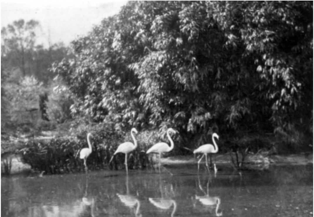
Flamingo's op Gooilust, 1909.

De N.V. Kina Cultuurmaatschappij te Amsterdam had in 1928 het oog laten vallen op het terrein ten zuiden van de Gooische Vaart in de gemeente 's-Graveland, waar zich nu de gebouwen van de sportvereniging Altius bevinden. Hier wilde