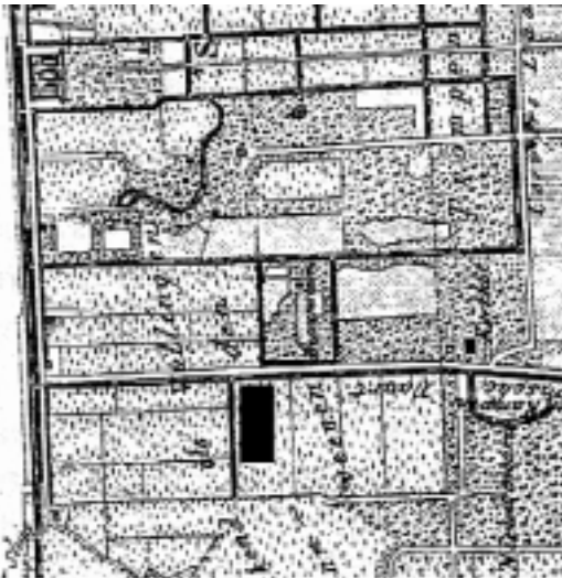
Kaartje van de Gooise Vaart met daarop de locatie van de kininefabriek. Aan de rechterkant bevindt zich de Stenen Brug.

het water uit de fabriek het slotwater zou verontreinigen. Het water van de Gooische Vaart is nl. al zo vuil, dat het water van de fabriek het alleen maar beter kan maken....' Graag wil hij een flesje met 'fabriekswater' rond laten gaan. Uit het zaaltje wordt geroepen '...hoe zit dat dan met dat zwavelzuur....?' Pleite: 'één bison van de heer Blaauw stinkt meer dan mijn hele fabriek ooit zal doen!'