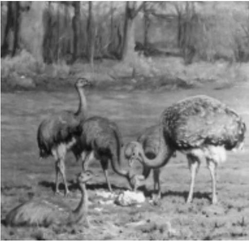
Een groepje nandoes op het landgoed Westerveld, geschilderd door August le Gras in 1894, kort voor de verhuizing naar Gooilust.

groot belang was, verontreinigd zou worden door het afval van de fabriek. Blaauw trachtte daarom met de Cultuurmaatschappij tot een vergelijk te komen over een andere locatie; hij schijnt zelfs andere gronden te hebben aangeboden. Maar daarvoor vond hij geen gehoor.