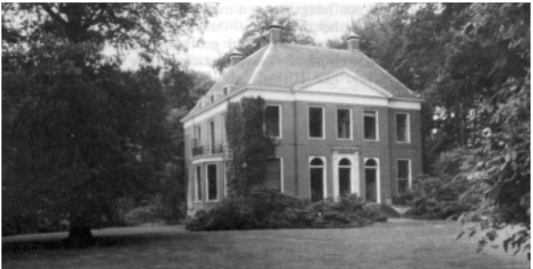
Het huis Gooilust in de huidige toestand.

De kininefabriek 'Argasani' zelf werd overigens alvast in gebruik gesteld, 'op z'n zondags', d.w.z. 'op halve kracht', hetgeen op grond van de Hinderwet mogelijk was. Op 9 maart 1930 vond de opening van de kininefabriek plaats. Blaauw was ook uitgenodigd voor deze plechtige gebeurtenis, maar hij bedankte begrijpelijkerwijs voor de eer. Toch was hiermee de kous nog niet af.