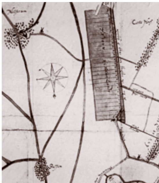
Op deze uitsnede van de 'Caerte van Goijlandt van Hilversum tot Vreelandten Naerden tot Weesp' van C. Danckersen de Rij uit 1636 is duidelijk te zien dat de 27 kavels van de 's-Gravelandse ontginning – de bron van het conflict – aan de Hilversumse kant liggen van de scheiding van het Gooi en het Sticht. N.B. Het noorden ligt op de kaart onderaan.

De baljuw, die als vertegenwoordiger van de regering van het gewest Holland de top van de bestuurlijke en justitiële piramide vormde, had zowel in de stad Naarden als in de Gooise dorpen in de persoon van de schout zijn eigen vertegenwoordiger. De schout representeerde lokaal dus het centrale gezag en kwam ook op voor de belangen daarvan. Naast hem stonden de lokale bestuurders die primair opkwamen voor de plaatselijke belangen en privileges: in de dorpen waren dat de schepenen, de buurmeesters en de raden. De functie van schout hield verschillende zaken in: hij presideerde het college van schout en schepenen, dat de civiele zaken van het dorp behandelde; hij was hoofd van de politie en hij zat de vergadering van het dorpsbestuur voor. Dit werd gevormd door de schout, de schepenen, de buurmeesters en de raden. Enerzijds werd het schoutambt begeerd omdat het allerlei financiële voordelen bood; het negatieve gevolg daarvan was dat er ook personen op afkwamen die het minder nauw namen met de eerlijkheid en weinig bekwaam waren. Anderzijds bracht de uitoefening van zijn functie de schout soms in een moeilijke, enigszins