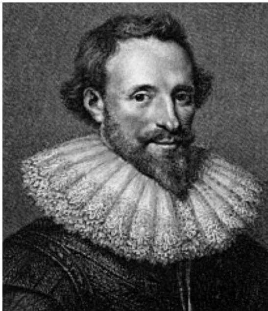
Pieter Corneliszoon Hooft (1581-1647). Fragment van een gravure van J. Houbraken uit 1738, naar een tekening door J.M. Quinkhard van het schilderij van M. van Mierevelt uit 1629. Hooft is op deze gravure omstreeks achtenveertig jaar. (part. coll.)

Op 10 februari richt Hooft zich met een uitvoerig ambtelijk schrijven opnieuw tot de Rekenkamer. Hij zet uiteen wat er zich allemaal heeft afgespeeld in Hilversum. De schout heeft uit een aantal door Hooft genomineerde kandidaten een geheel nieuw college van vijf schepenen gekozen. Deze gang van zaken had Hoofts instemming, maar week wel af van de bestuurlijke traditie, die voorschreef dat er kandidaten werden gezocht die al eerder in de schepenbank hadden gezeten. Van dit nieuwe college heeft niemand ooit eerder deze functie vervuld. Hooft legt uit waarom hij zo heeft gehandeld. Er moest in Hilversum schoon schip worden gemaakt, want alle andere mogelijke kandidaten be-