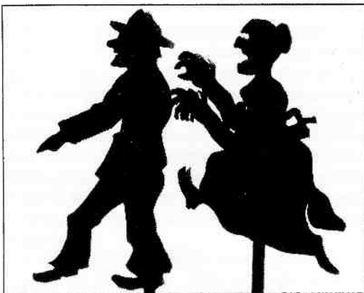
Schimmen van Ger Boonstra. Nog maar kort te zien in de tentoonstelling 'Pop en theater' in het Goois Museum te Hilversum.

Een videoprogramma toont fragmenten uit diverse voorstellingen. Jonge bezoekers kunnen spelen met een echte poppenkast en zo lang de tentoonstelling duurt zijn er regelmatig poppenkastvoorstellingen.