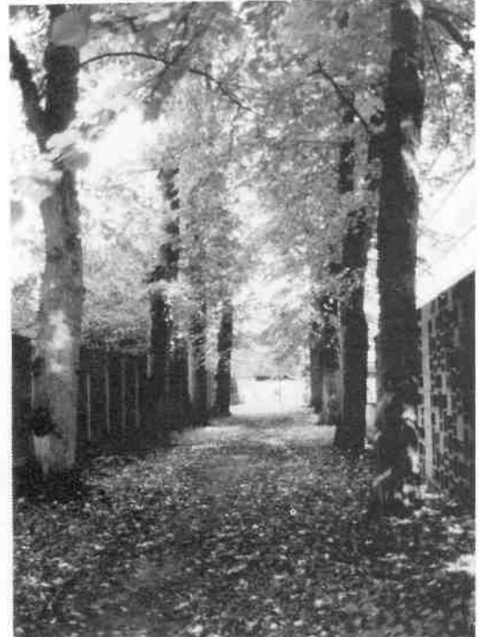
Tussen de Vaartweg en de Bergweg heeft het naamloze pad het karakter van een laan.