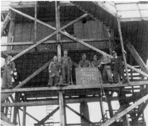
De vorm van de torens is vrijwel conform de eerder geplaatste tekening die gevonden werd bij de opgeblazen toren, dicht bij de Bachlaan in het Spanderswoud.