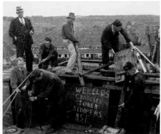
Met zichtbaar genoeg namen werknemers van de NSF na de oorlog de sloop van de Flaktoren ter hand. Hun bord met het opschrift: "WERELDS GROOTSTE TOREN-SLOOPERS NSF" spreekt voor zich.