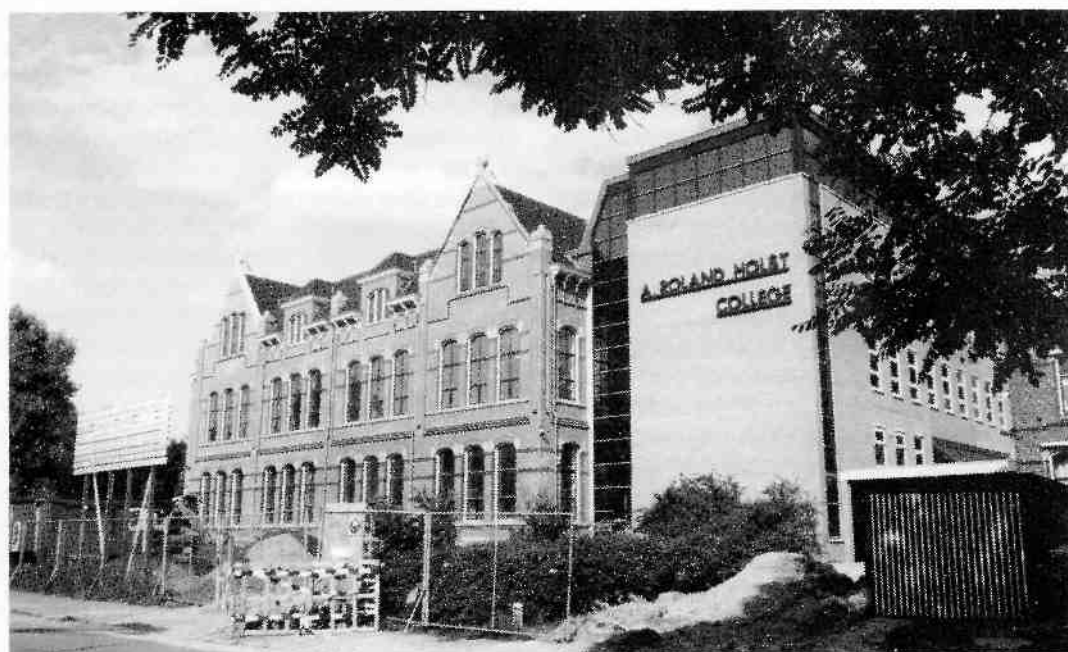
Onder: de Dudok-aanbouw werd bij de recente verbouwing en renovatie gesloopt en vervangen door een eigentijdse vleugel (foto juli 1993: JEL).