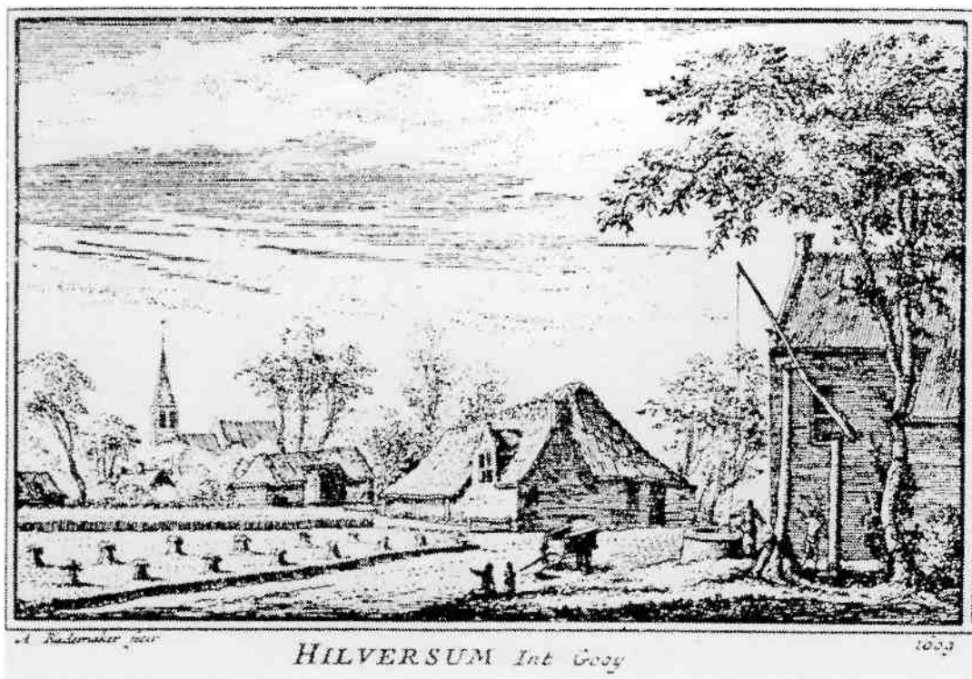
Het DORP HILVERSUM in Gooiland liggende in aengename Zaeilanden niet ver van de Stadt Naerden, zoo als zich dat vertoonde in den Jare 1609.

Toen Abraham Rademaker, de graveur, op de morgen van die 24ste juni in Het Gooi zat te tekenen, 'quamen de boeren daer omstreeks, zich verbeeldende, dat hij daer iets verrigte ter bevorderinghe van die godloze onderneming, gewapent met knuppels en vlegels op hem af, met so veel vaert en geweld, dat hy nauelyks tijt had om de slagen van hunnen dommen yver met levensgevaer te ontvluchten; waervan hy zulk een doodelijken schrik zette, dat hy eenige maenden daerna den geest gaf.'