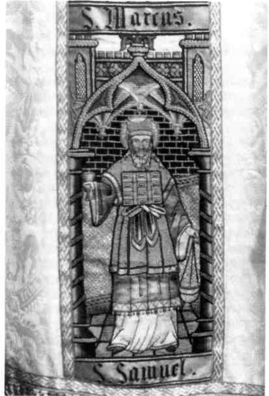
Detail van de kazuifel met de profeet Samuel.