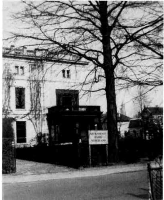
Oprit van Melkpad 34 met het bord 'Nieuwsdienst Radio Nederland' in 1947. Duidelijk zichtbaar is de karakteristieke dakafwerking van de villa. Vanwege neerstortingsgevaar zijn de op het platte dak opgemetselde penanten in de jaren '60 verwijderd.

Na de bevrijding is het Radio Hertzijnd Nederland, een door het Militair Gezag gecontroleerde organisatie, die de nieuwsuitzendingen verzorgt. Vanaf 19 januari 1946 neemt Radio Nederland in den Overgangstijd (RNIO) deze taak over. De redactie van 'Nieuwsdienst Radio Nederland' blijft gehuisvest op het Melkpad getuige het bord in de tuin.