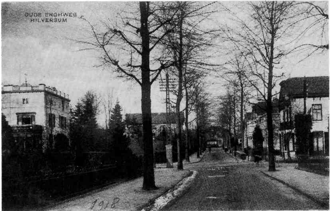
Gezicht op de villa "Nieuwen Engh" links, vanuit hetzelfde perspectief maar nu rond 1918. De boompjes zijn bomen geworden en er zijn veel meer villa's verschenen, wo. links achter de gemoderniseerde telefoonpaal het loggebouw van de Vrijmetselarij, gebouwd door Salm in 1905.

dat zijn dochters – op de oudste en jongste na – het ouderlijk huis verlaten hebben, vestigt de familie Jaarsma zich op 5 januari 1914 in 's-Gravenhage. 5