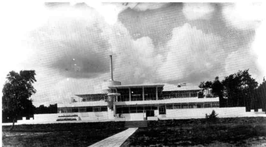
Aanzicht van het hoofdgebouw van Zonnestraal aan de voorzijde, gezien vanaf de vroegere heide. De foto dateert van ca. 1930. Opvallend zijn de grote dakoverstekken, de glimmende metalen schoorsteen op het waterreservoir en de grote transparante glasvlakken.

nodig. De postume uitreiking van de cultuurprijs van de gemeente Hilversum aan Jan Duiker in 1970, slechts vijfendertig jaar na zijn dood, toen zijn gebouwen reeds in ruïneuze staat verkeerden, is in ieder geval zonder grote commotie voorbij gegaan, is behalve door professoren en wetenschappelijk medewerkers aan T.H.'s dan wel T.U.'s nauwelijks opgemerkt, en heeft het geweten van de plaatselijke overheid voor pakweg de daarop volgende vijfendertig jaar gesust.