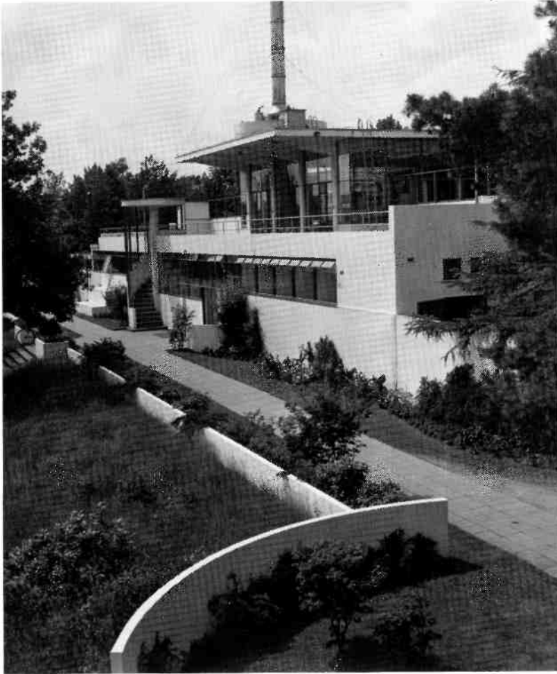
De transparantie en de overstekken komen op deze foto van het hoofdgebouw, genomen vanaf het Dresselhuys-paviljoen, fraai tot uitdrukking. Links de betonnen spiltrap met paddestoel-dak. Op deze foto uit de jaren '40 is het begin van het verval al zichtbaar. De glimmende metalen schoorsteen is vervangen door een exemplaar van eternitpijpen.

te schoonheid), Gooiland dreigt half gerestaureerd te gelde gemaakt te worden, de AVRO studio is met weinig gevoel aangepast, de VARA verkoopt zijn complex aan het NOB, om vervolgens in een gebouw van een projectontwikkelaar te trekken, hetgeen niet hoopvol stert voor de toekomst van het voormalige VARA complex. In tijden van schaarste is het N.O.B. een slechte hoeder van onze cultuur waar het gebouwen betreft.