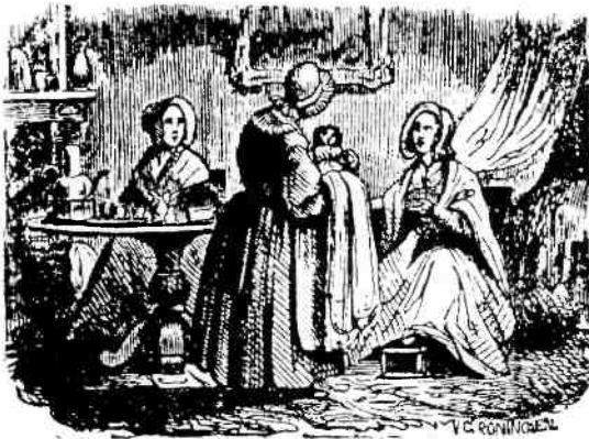
Bakerpraatjes: uit onwetendheid kregen zuigelingen door ongeschikt voedsel vaak ingewandstoornissen.

Vooraf in de poldergebieden was de kwaliteit van het drinkwater uitermate slecht. Het was in feite oppervlakte-water, ook als het uit een pomp kwam. En in de sloot verdween ook een groot