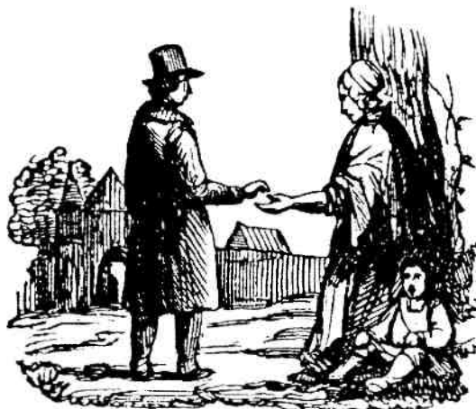
De jaren net voor 1850 waren bijzonder zwaar en brachten mensen tot de bedelstaf.

Het weer bepaalde in de akkerbouw het succes van de oogst, in de veeteelt wanneer de koeien van stal konden, of er genoeg voer was om ze door de winter te slepen of dat ze geslacht moesten worden.