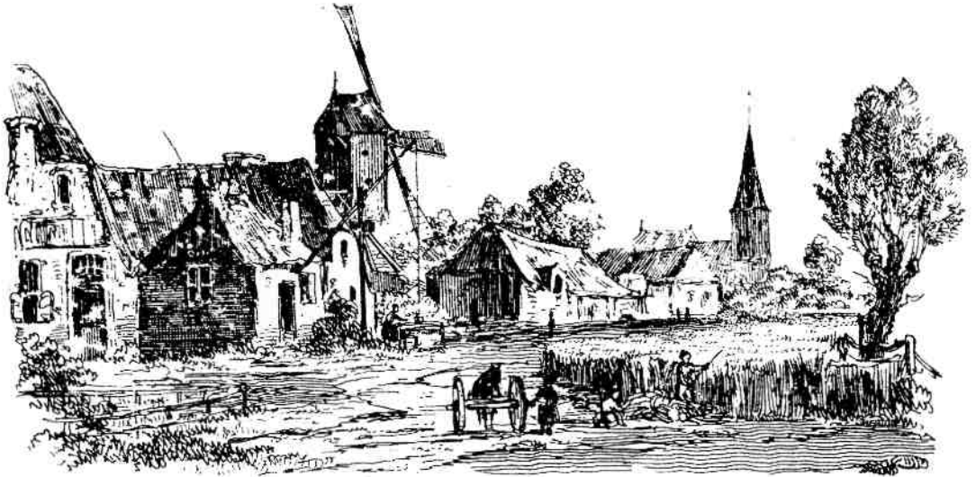
Een vrije impressie van Hilversum, zoals afgebeeld in het 'Penning-Magazijn voor de Jeugd', 1837. Het commentaar bij de afbeelding van 'het bloeiendste en welvarendste dorp van het geheele Gooiland' zou een illustratie kunnen zijn van de betrekkelijke welvaart die er in die tijd op het platteland heerste.

het eenvoudige plattelandsleven. Daarom werd het in die jaren mode om op grote schaal de bijl te zetten in het middeleeuwse erfgoed van de stad.