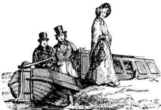
De benenwagen en de trekschuit waren tot 1850 de meest gangbare vorm van vervoer.

Veel dingen lagen vast in het leven op het platteland in 1850. Elke week markttag in de stad, en elke zondag naar de kerk. Elk jaar kalvertijd, hooitijd, grote schoonmaak en kermis op het dorp. Tegelijkertijd werd het leven veel meer gedictieerd door de wisselvalligheden van de dag. Het weer, de seizoenen en ziekten van mens, vee en gewas hadden een onvergelijkbaar grotere uitwerking.