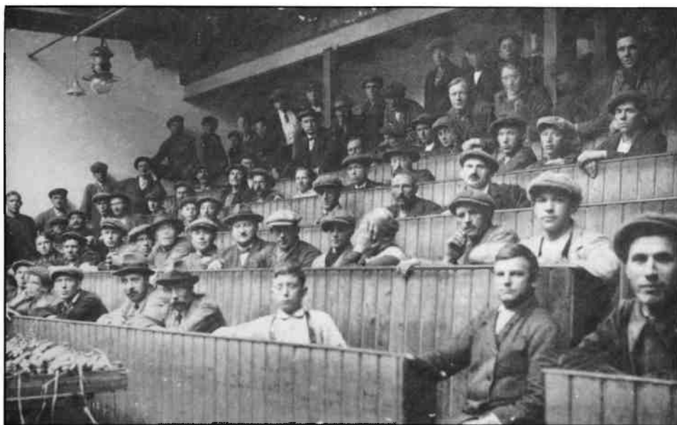
De handelaars bij de eerste groenteveiling in 1913 in de banken van waaruit ze de klok konden stilzetten. De enige vrouw op de foto had wat moeite met de fotograaf.

voor een nieuwe beschoeiing aan de vaartkant voor het lossen der schuiten en voor de aanleg van rails voor het af- en aanrijden van rollende presenteertafels naar het veilinggebouw.