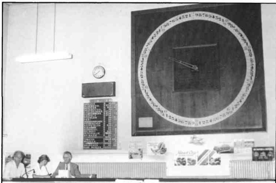
De klok in het veilinggebouw. Geheel links de heer Nouwt de laatste afslager en voorzitter van de veilingvereniging.

Verder verdween veel tuinbouwgrond wegens uitbreiding van de woningbouw in de gemeenten.