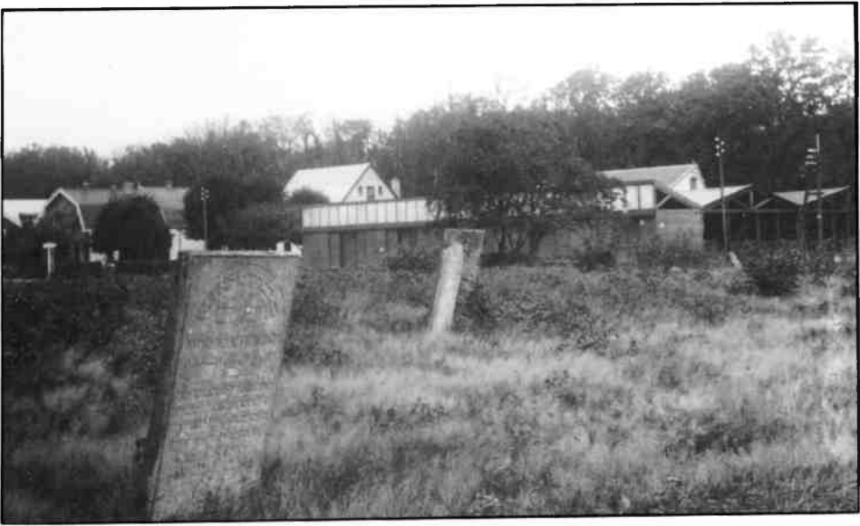
Het gebouw van de 'Coöperatieve Veilingvereniging Hilversum en Omstreken' gezien vanaf het voormalige Israëlitische Kerkhof aan de overkant van de Vaart, waar nu de Nieuwe Havenweg loopt. De foto werd ca. 1930 genomen.