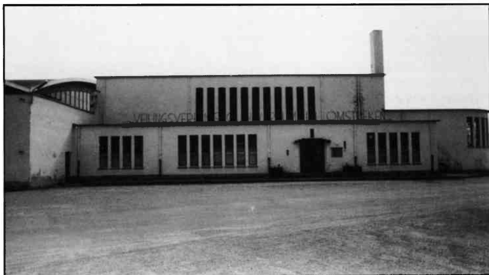
Een deel van het veilinggebouw in 1982 met links een klein stukje van de groente- en de laatste jaren ook bloemenhal en uiterst rechts de kantine.

vrije zaterdag een vergadering. De agenda had één punt namelijk: 'de vroege veiling op vrijdag'. Het bestuur was tot de beslissing gekomen om vrijdags om 7 uur v.m. te veilen en 's middags om 12 uur, dan zou de handel nog tijd hebben om vrijdagavond nog klanten te bedienen want: 'zaterdag zijn er veel mensen niet thuis'. Deed de veiling dit niet dan was het bestuur bang, dat de handel zich zou bevoorraden via de grossierderij (groothandel) of dat de handelaars een andere veiling zouden bezoeken waar ook vroeg geveild werd. Dat moest worden tegengegaan. Gelukkig is alles meegevalen.