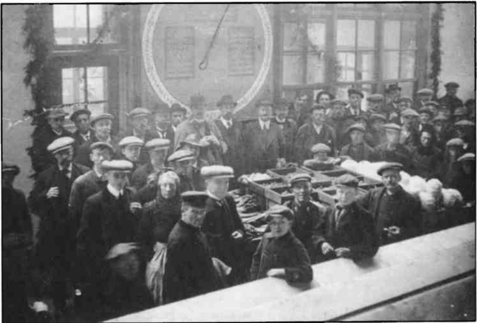
De eerste groenteveiling in het nieuwe gebouw aan de Berensteinseweg vond nog in 1913 plaats. De elektrische klok was voor die tijd zeer modern.