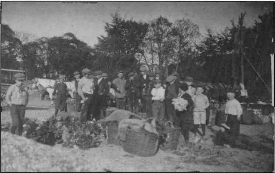
Rond 1912 vond de uitwisseling van groenten en bloemen van de tuinders aan de detailhandel plaats in de open lucht. De foto is vermoedelijk gemaakt dichtbij Café Dekker bij de Hondebrug.

Ruim 100 jaar geleden had men nog nooit van een veiling gehoord. In tuinbouwgebieden in Noord-Hollands zoals de Streek, Bangert, Langedijk en Kennemerland, werd toen al groente en fruit geteelt. De beurtschippers die toen voeren naar Amsterdam en Haarlem kregen deze produkten in 'consignatie' mee, met andere woorden de vrijheid om er een hoog mogelijke prijs voor te ontvangen. Was het produkt 'graag'