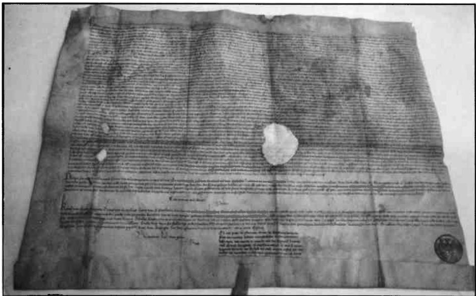
De eerste schaarbrief van 1404, volgens afschrift uit 1470 (coll. Staden Lande Stichting). In de schaarbrieven werden de voorwaarden vastgelegd tot het gebruik van meentweide, heide en veen. De 'schaar' hield de toelaatbare hoeveelheid vee in dat per gezin op de 'Gemeente' mocht grazen.

De sociale structuur van de typische es- of engdorpen wordt wel aangeduid als 'esgenootschap'. Functioneel gezien is het esdorp een typisch markedorp. Het bouwland op de eng was in principe particulier bezit, waar de 'gemeente' in gezamenlijk gebruik