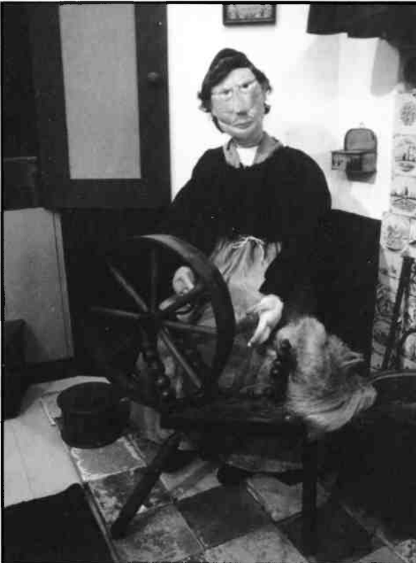
De textiele huisnijverheid leverde de belangrijkste neveninkomsten voor het Gooise boerengezin. (Tafereel Erfgooiertentoonstelling)

In de bos- en schaarbrieven wordt uitvoeriger stil gestaan bij de beperkende maatregelen en verboden, dan bij de voordelen. Het exclusieve gebruik moest behoud van de gemeente garanderen 'tot ewigen daghe'. Doch hoe strenger de bepalingen, hoe veelvuldiger de overtredingen. Daarbij eiste een toenemend aantal nieuwe stedelin-