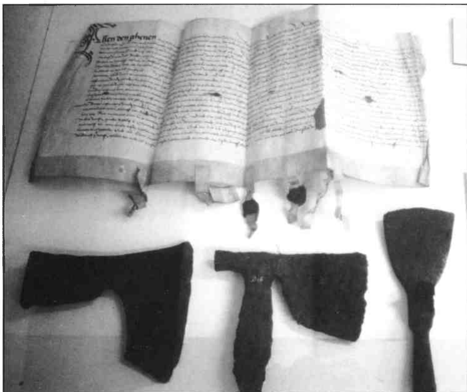
De oudste originele bosbrief uit 1514 (coll. Gemeentearchief Hilversum) en archeologische bijlen (coll. Goois Museum). Volgens de Middeleeuwse bosbrieven werd de 'houwinge' in het Gooierbos gereglemeenteerd. Zesjaarlijks markeerde de houtvester met een 'deelbijl' of 'merkijzer' het te kappen hout.

De woeste gronden waarvoor de oudste beperkende gebruikersreglementen werden opgesteld, waren de 'bosmarken' of 'maalschappen'. Men vergelijkte de Malen op