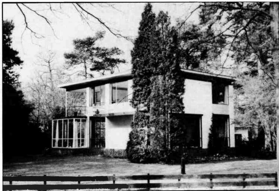
Rossinilaan 11, 1936. De gevels van de villa's uit de 30er jaren zijn niet mee gepleisterd. De bakstenen zijn eenvoudig wit geschilderd. De villa heeft ook grote vensteroppervlakken, hoewel de gevels waarachter de nevenfuncties gesitueerd zijn meer gesloten zijn. De serre, aan de linker zijde, is niet origineel. Oorspronkelijk bevond zich daar een inpandig balkon.

Uit deze villa's uit 1929 en 1930 blijkt dat Elling nog aan het experimenteren was met materialen en technieken. Het dakterras aan de Hertog Hendriklaan heeft in de