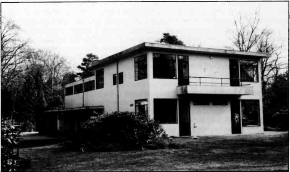
Joelaan 2, 1930. De gevel naar de tuinzijde is geheel open, in tegenstelling tot de gevel aan de andere zijde waarachter zich de nevenfuncties bevinden. Vanuit elk vertrek kan via een deur gemakkelijk de buitenruimte bereikt worden. In deze villa zijn de typische vensterindeling (T-venster met de staande stijl uit het midden geplaatst en een klapraampje) en balkonvorm, die bij elke latere villa terug zullen keren, al aanwezig.

De familie Doyer, meneer Doyer was een oud Indië-ganger, wilde zich in het Gooi vestigen. De familie had een villa in de romantische stijl in gedachten. Ondanks het feit dat Elling geen werk en geen geld had, weigerde hij een villa in die stijl te ontwerpen. De inmiddels voltooide villa aan de Hertog Hendriklaan maakte blijkbaar toch