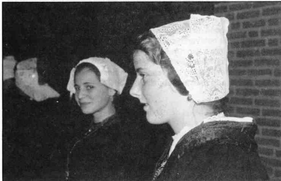
Tijdens de klederdrachtenshow werden verschillende soorten mutsen getoond.

Na de pauze werd een show gepresenteerd door 14 dames en heren,