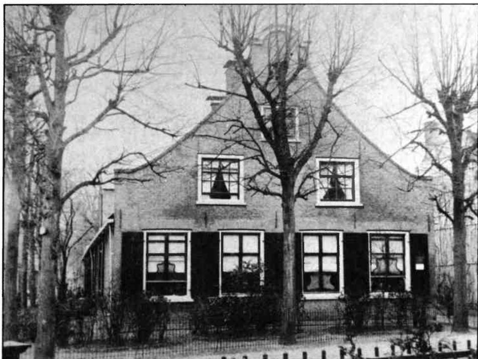
De situatie van de boerderij aan de Langestraat 103 in 1890. De roedeverdeling van de bovenramen zijn in 1899 gewijzigd. Ook de twee ramen in het midden van de begane grond werden toen vervangen door openslaande deuren.

Over de bouwgeschiedenis van deze boerderij is weinig bekend. Het pand werd vlak na de grote brand van 1766 als boerderij gebouwd of wel-