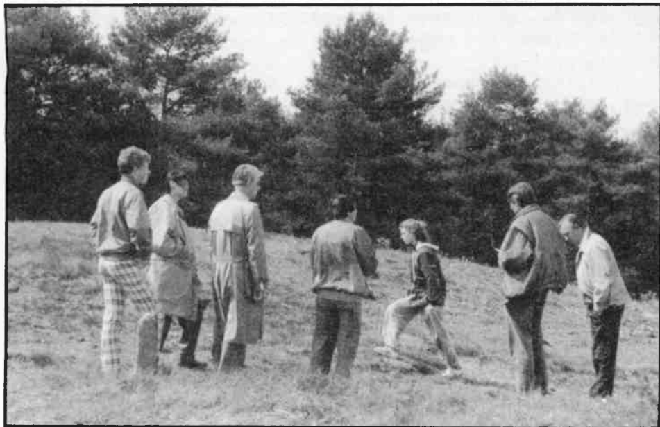
foto boven: deelnemers aan de excursie bij één van de grootste grafheuvels die de Westerheid rijk is.

Sporen van meer recente bewoning zijn gevonden op de