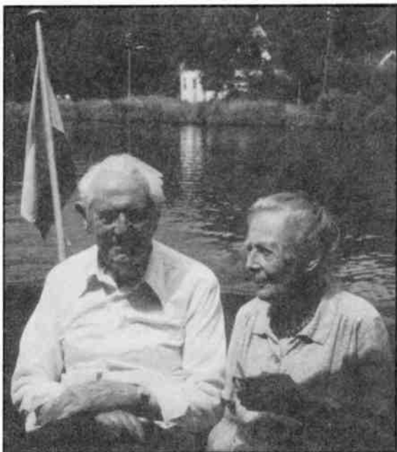
De boog was niet altijd gespannen. Tijd voor een boottochtje over de Vecht (zomer 1982).

Samenvattend concludeert hij, dat er geen monumentenbe-