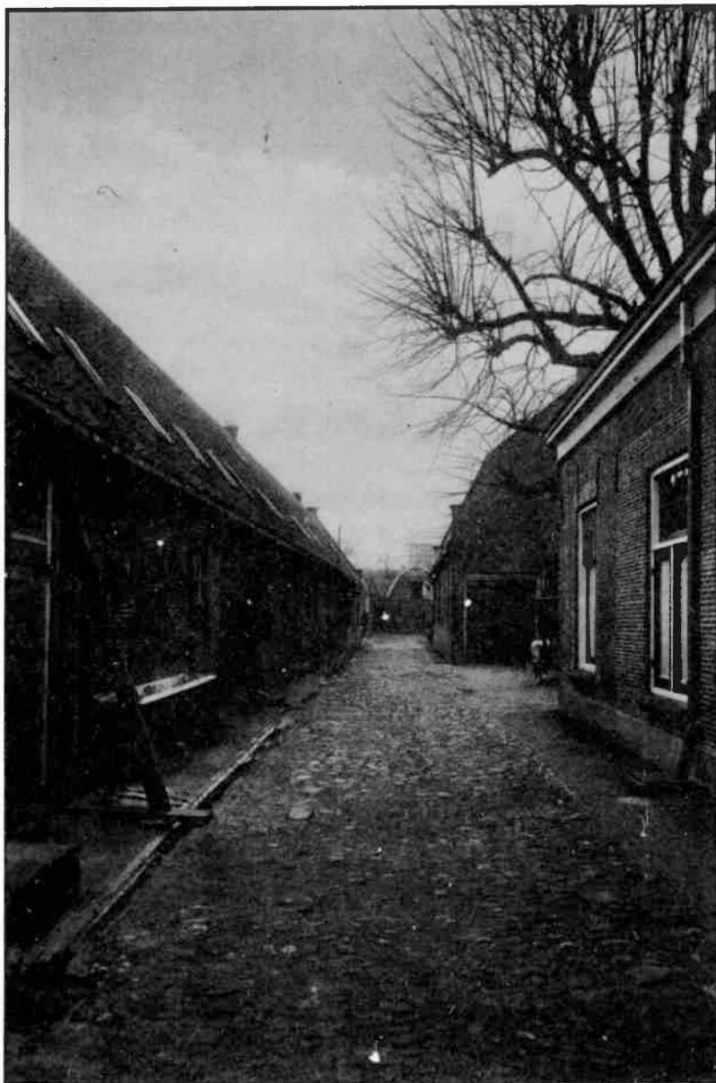
Groest 104-108 staat heel terecht op de monumentenlijst en geldt als te beschermen dorpsgezicht. Het gebouw rechtsachter is ondanks dat in februari 1986 gesloopt.