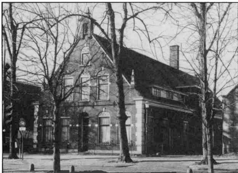
Het fabrikeurshuis Groest 104-106.

blok met één verdieping dat loodrecht op de weg-richting van de Groest is geplaatst. Het werd gebouwd na de brand van 1766 die in het naburige pand nr. 110 uitbrak. Het wordt beschreven als 'baksteenornamentiek met classistische elementen'. De heer J. Postma, ons medelid en bouwkundige, die voor ons de situatie op de Groest 104-108 in ogen-schouw nam, wijst op pinakelachtige elementen in het bouwwerk, die ook te vinden zijn in de hoofdge-vel van de beroemde Vleeshal te Haarlem (zie af-beelding). Het zadeldak wordt enigszins ontsierd door later gebouwde dakkapellen. Dit type woning is in Hilversum bekend geworden als fabrikeurshuis. Een deel heeft dienst gedaan als tapijtweverij.