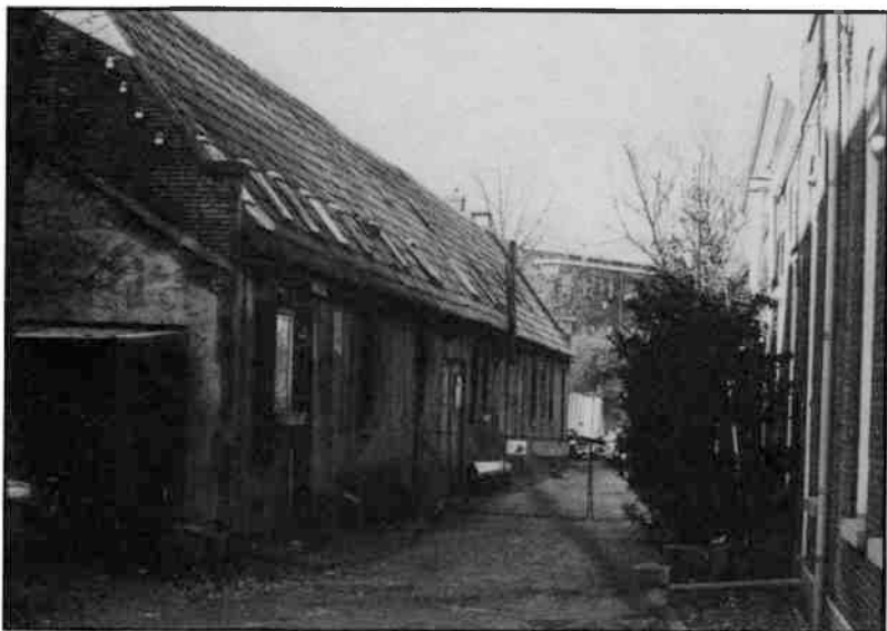
De lange schuur naast het fabrikieurshuis is ook nu nog in redelijk goede staat.

eenvoudig gebouw waarvan de historische waarde hoger moet worden geacht dan de architectonische waarde, maar dat juist in de samenhang met de omliggende gebouwen onvervangbaar is. Hij meent dat de fundamenten en muren goed genoeg zijn voor een grondige restauratie en dat het gebouw voor eigentijdse bewoning geschikt te maken zou zijn.