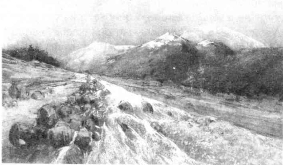
"Gletscherbeek met eindmorene", pastel van Herman Heijenbrock (1935), vervaardigd voor de geologische afdeling van het Gooisch Museum. Koll. Dienst voor Cultuur, Gemeente Hilversum.

De gesprekken tussen Gooisch Museum en Gooisch Natuurreservaat over een samen in te richten museum staan vermoedelijk in verband met de plannen voor een nieuwe huisvesting. In 1941 namelijk had de gemeente Hilversum het voornemen het voormalige raadhuis aan de Kerkbrink af te breken. De stadsarchitect Dudok ontwierp op een terrein